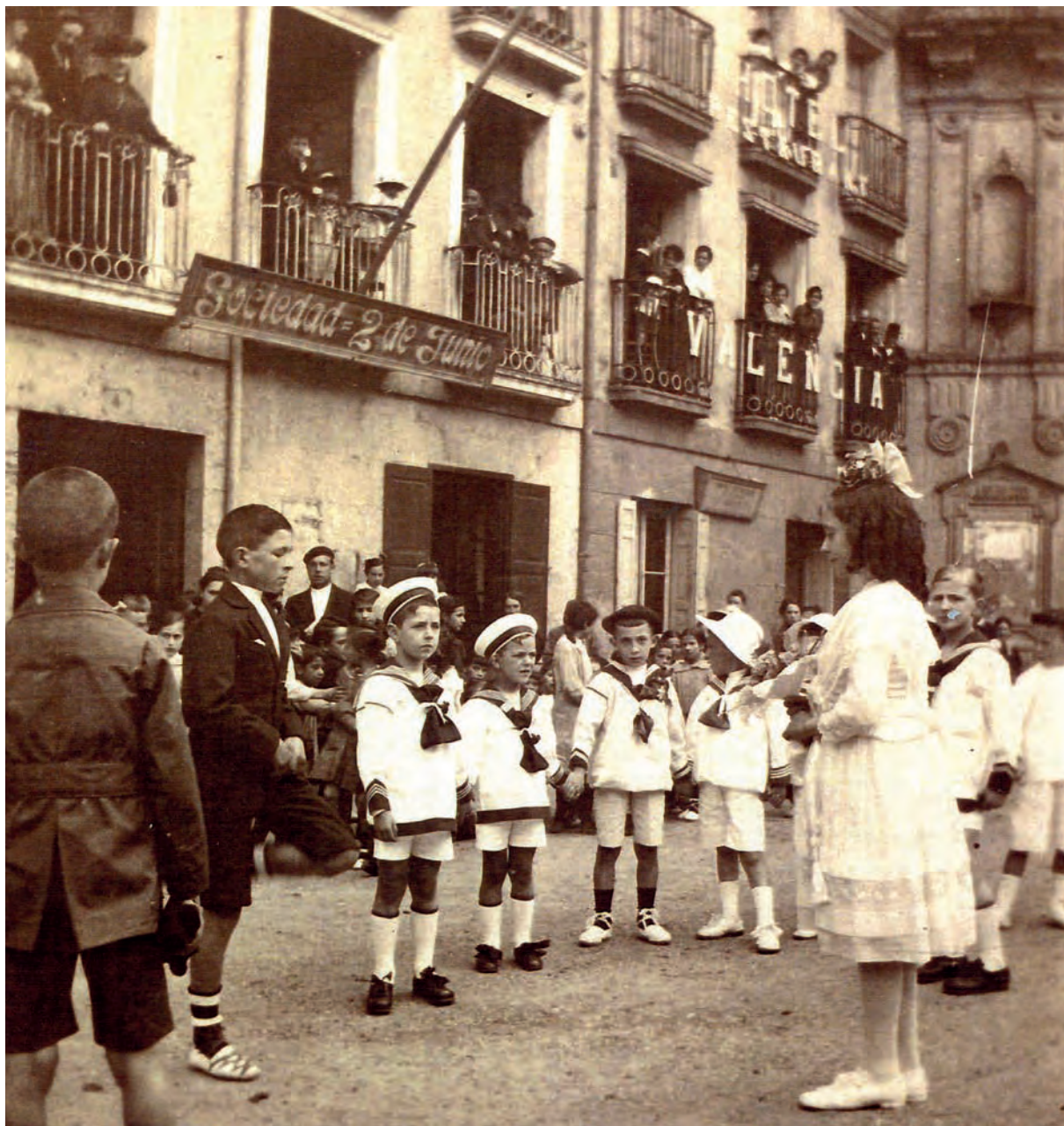
"Sociedad = 2 de Junio", en la fachada de una de las casas de la Plaza Mayor. 8

Durante los primeros años la fiesta tenía como objeto el homenaje a los supervivientes del asedio. En general, la fiesta comenzaba con dianas, chupinazos y salvas desde el fuerte de Santa Bárbara. Luego, misa, con funeral o Te Deum , una recepción en la casa consistorial a la que acudían alcaldes y representantes de muchas localidades. A veces, se organizaron partidos de pelota o conciertos, e invariablemente tenía lugar un banquete, que terminaba, a la tarde, con bailes, y por la noche fuegos artificiales.