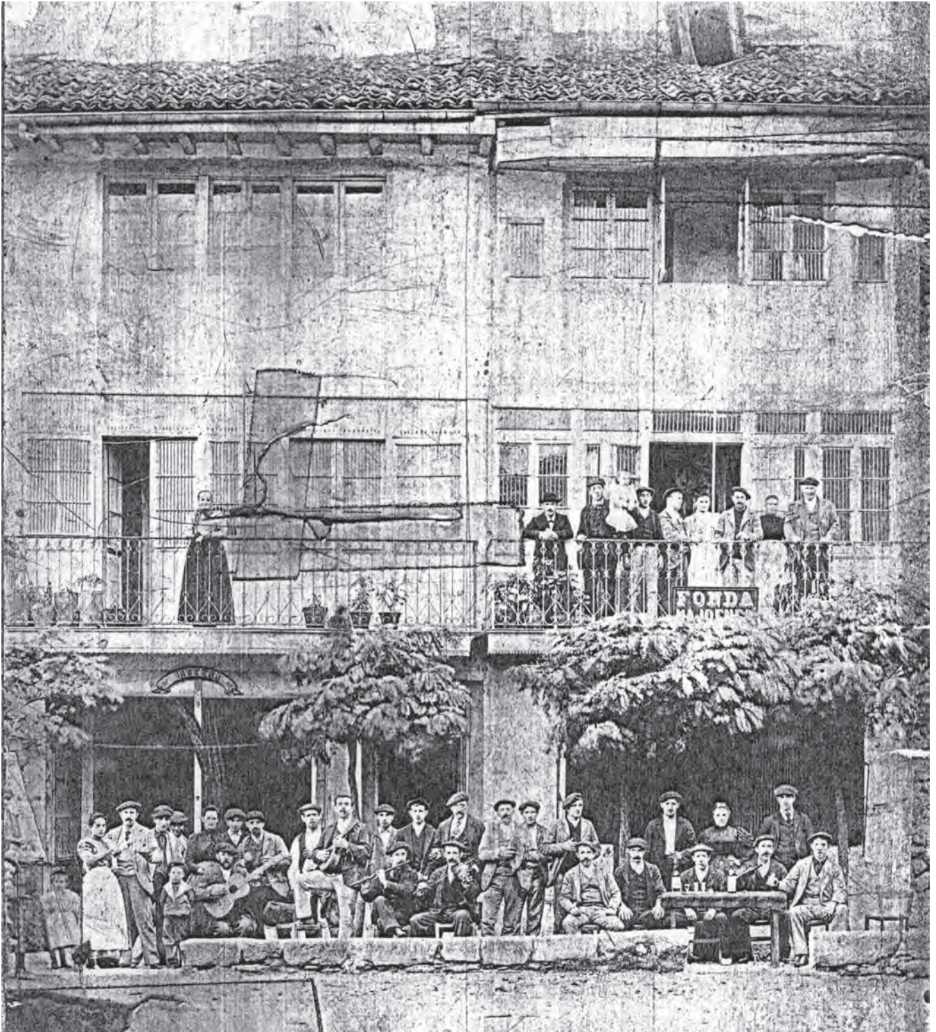
HUA / ARGAZKIAK // HER00334.