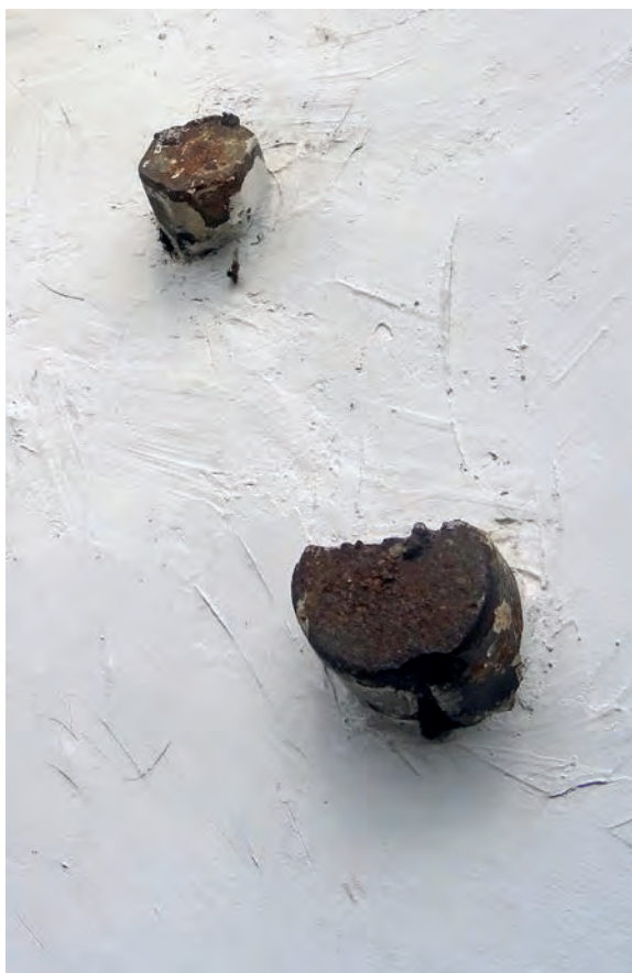
Proyectiles en la fachada de Atzieta kalea 39.

Y apunta también, que "de 174 caseríos que tenía Hernani, 12 fueron destruidos, 14 quedaron inhabitables y solo diez permanecieron intactos".