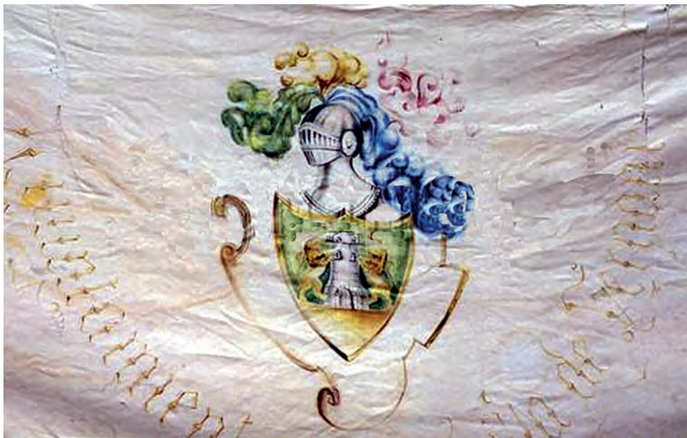
Imagen de la nueva bandera bendecida en 1906.