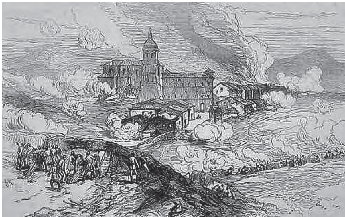
"Événements d'Espagne. Bombardement d'Hernani par les carlistes / Bombardeo de Hernani por los carlistas" (L'univers illustré. 1874)

El 30 de mayo, tras conocerse la rendición de los sitiadores, se organizó la defensa de la villa, que seguía amenazada por el fuego de artillería carlista, ese intenso fuego seguía siendo contestado desde la batería de Santa Bárbara. El 31 de mayo, continuaron los ataques sobre Hernani... El 1 de junio, "únicamente" cayeron sobre la localidad "158 balas y fuego de fusilería". Y el 2 de junio, finalmente se retiraron los sitiadores... "dejando como rastro el incendio de una casa en la plaza que ocasionó tres muertos y veinte heridos"