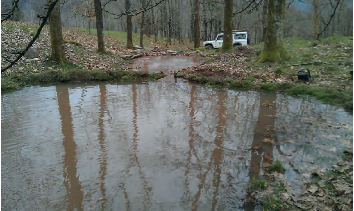
Aranzadik Putzuxar azpialdean eraikitako putzuak. Egurra, zotala eta hargorria erabiliz.