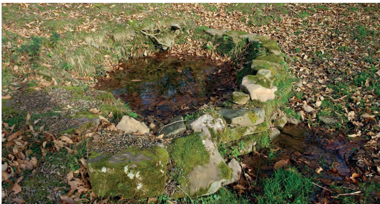
Putzuxarko putzua, hargorritz eta zotalez inguratua.

Iturriaren bueltan-bueltan hargorria jarri eta horma txiki bat sortzeak ura lur azpitik ateratzen den eremua inguratzea ekarriko luke, baina hori ez da nahikoa ura pilatzeko. Izan ere, harrien zirrikietatik barrena alde egingo baitzuen urak. Hala, zulo horiek estaltzeko zementurik ezean, zotala erabiltzen zuten harri arteko tarteak tapatu eta iragazkaitzeko. Zotala jarri, eta ondoren harria jarriko zen, eta ondoren, berriz, harria, eta zotala, eta harria... hala, iturburu inguratuko zuen egitura eraikiaz, eta uraren alde egiteko aukerarik eman gabe, ura pilatzen eta putzua sortzen joango zen. Eta hala, iturburuak izena hartuko zuen: Putzuxar.