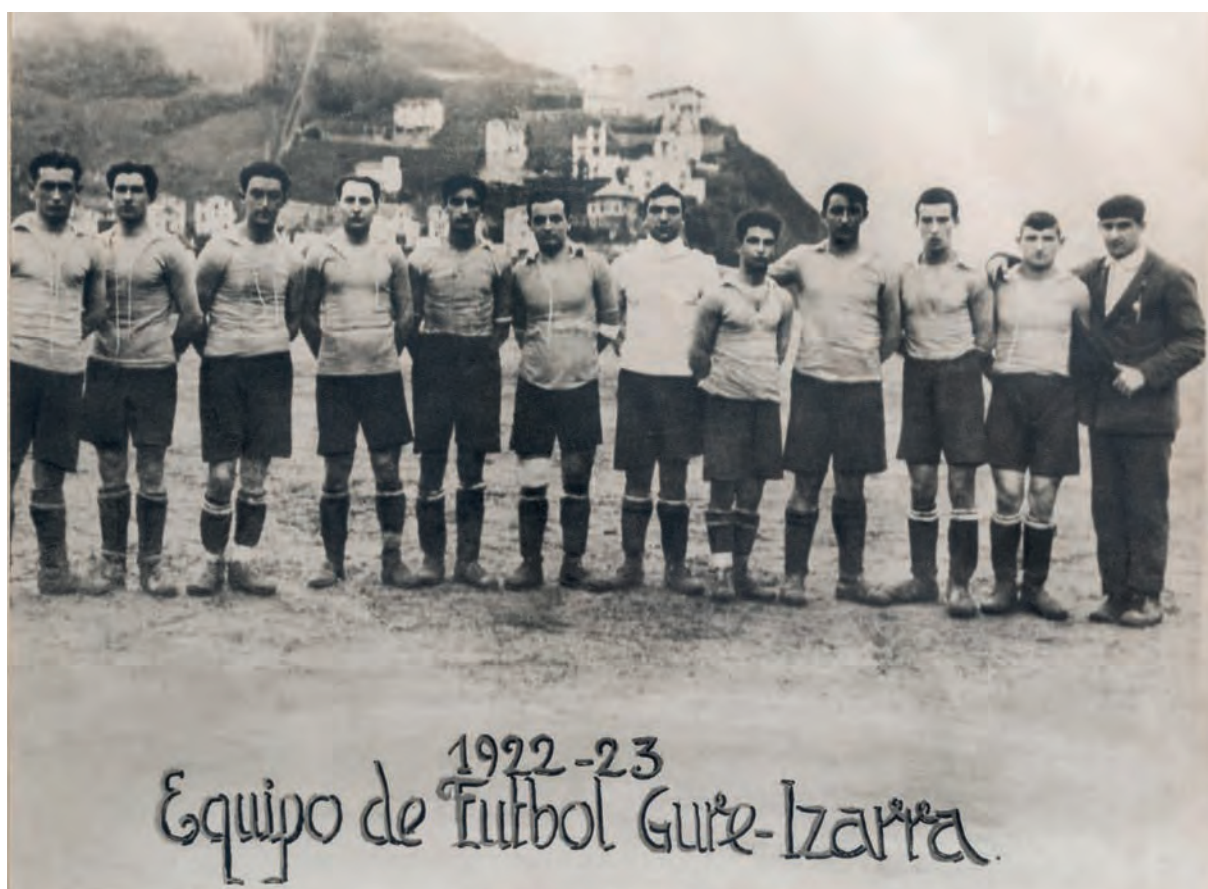
Temporada 1922-1923. Equipo GURE IZARRA en el campo de Ondarreta.

Aquel modesto pero gran equipo que entre los años 1922 y 1927 se enfrentó a equipos tan importantes como la Real Sociedad, Real Unión de Irún, Osasuna, C.D. Logroño, Racing de Santander, Arenas de Getxo etc.