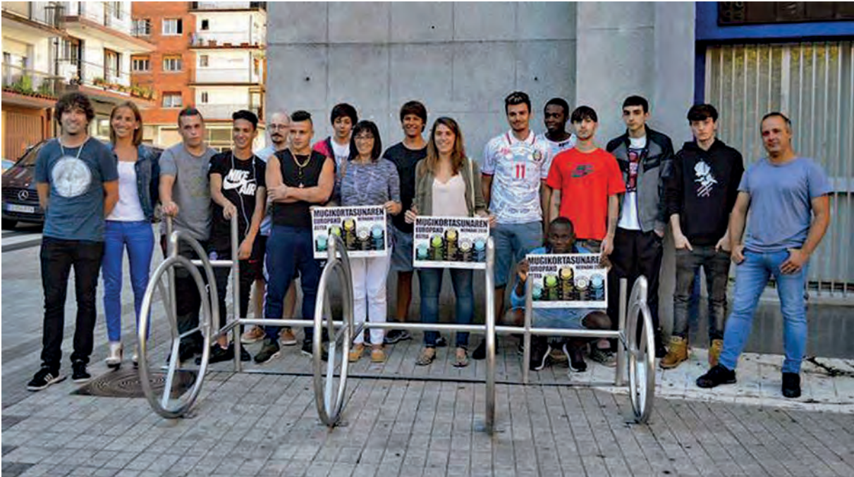
Lanbide Heziketako ikasleak bizikletak aparkatzeko gailu berriaren aurkezpenean, ikastetxe atarian.