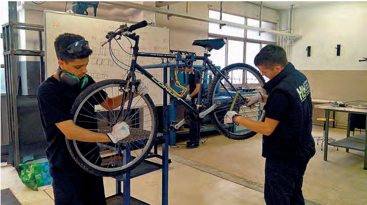
Lanbide Heziketako ikasleak bizikleta zahar bat konpontzen, bigarren bizitza bat emateko.