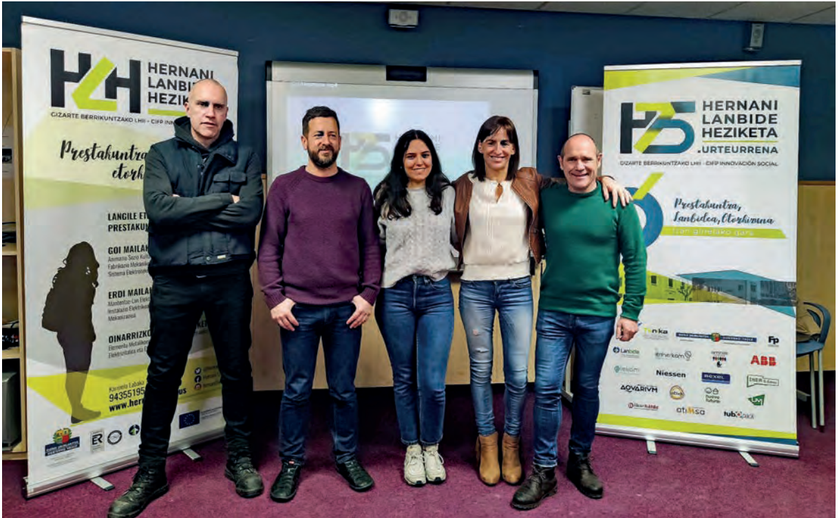
Urteurrenako prentsaurrekoa Hernaniko Udala, Ikaslan eta Ikastetxearen eskutik.