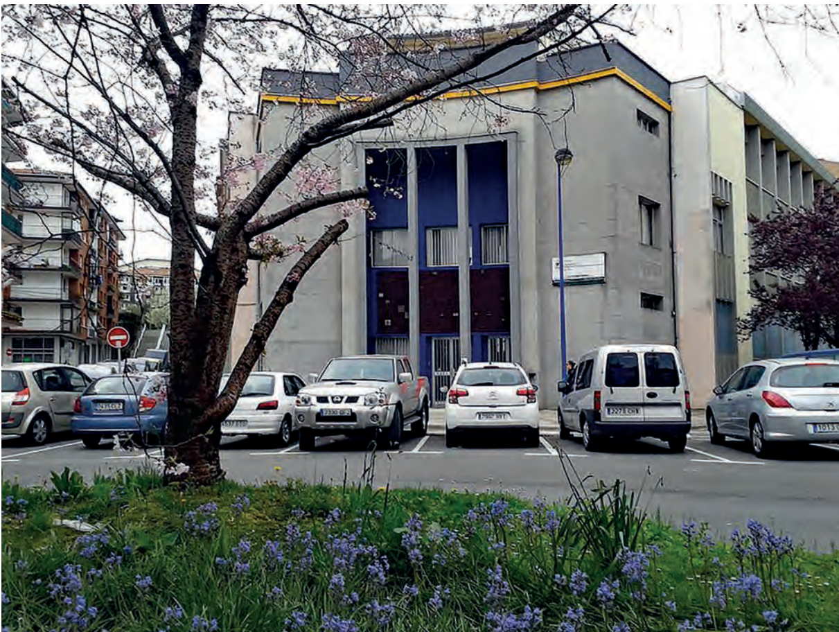
Gizarte Berrikuntza, Hernaniko Karmelo Labaka kalean.

Lanbide Heziketako ikastetxeak eta enpresa mundua etengabeko hartu emanean daude, azken batean, funtsa ikaslea lanera joateko prestatzea baita. “Edozein ziklo