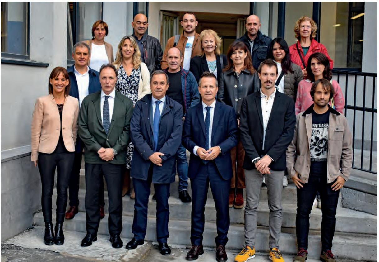
Hezkuntza arloko arduradun ezberdinak eta Hernaniko Udala ikastetxean.