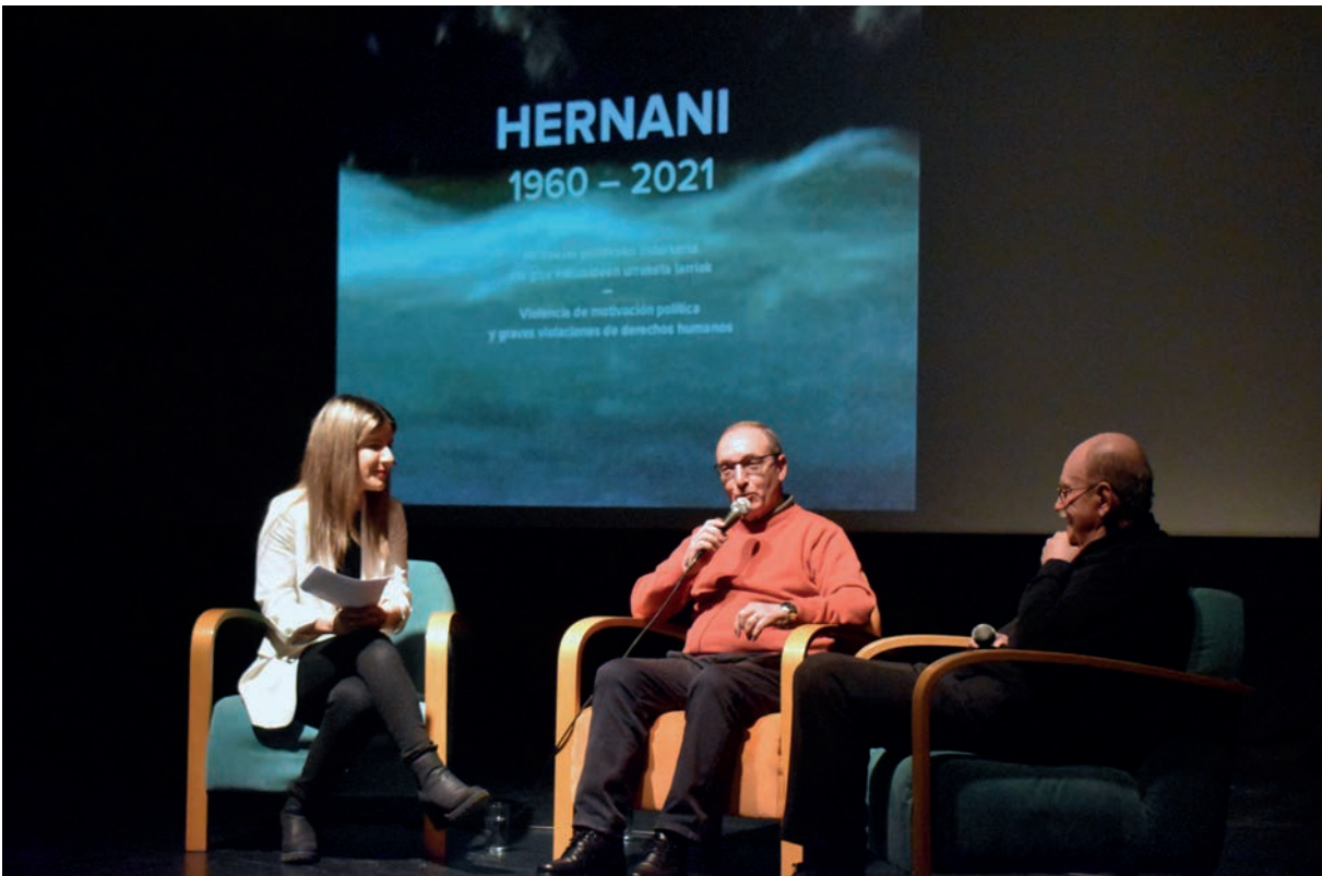
Arlo politikoan, Udal Bizikidetzaz Mahaiaik urrats garrantzitsuak eman ditu, azken urteotan. Horien adibide, 2015ean Ave Maria parkean jarritako "Memoriaren harria" (eta Maialen Lujanbioren bertsoak) eta 2023an aurkeztutako "Hernani 1960-2021. Motibazio politikoko indarkeria eta giza eskubideen urraketa larriak" liburua.