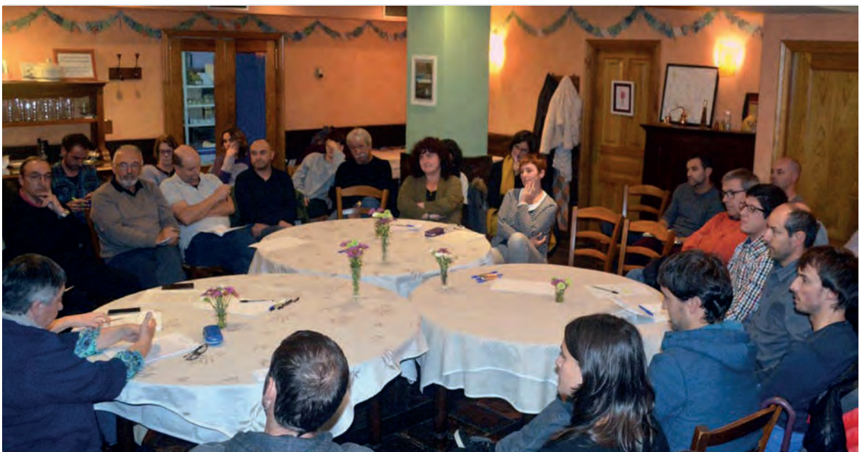
2014 eta 2016 urte bitartean, azken hamarkadetan Hernanin gertatutakoaz aritutako hernaniarrek euren bizipenak herritarrekin partekatu zituzten, Errioguarda enea jatetxean.

2014 eta 2016 urte bitartean ibilbide pertsonal eta ideologiko ezberdina zuten hamar herritarrek elkar ezagutza prozesu bat burutu zuten. Euren bizipe-