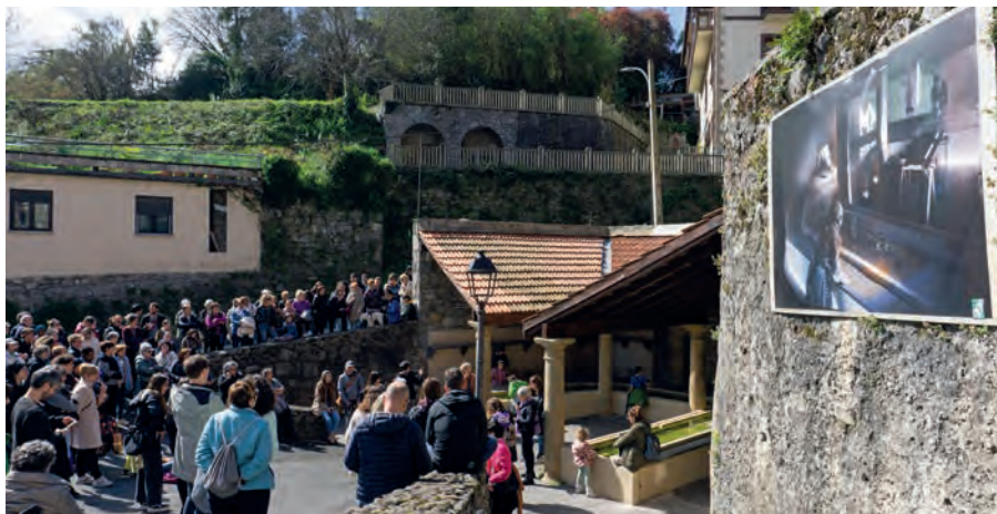
Leokako labaderoa. Hernaniko ibilbide morea 2023ko martxoaren 26an aurkeztu zen jendaurrean.

LEOKA GARBITOKIA ezaguna da herrian, antzinako lanbide baten lekuko. Bertan elkartu ohi ziren emakumeak erropak garbitzeko, horietako asko neskameak. Baina garbitoki hau, bazen ere andreak elkartzeko, sozializatze eta politika egiteko gune bat. Geltoki honek garbitzaileen lan gogor eta inbisibilizatua omentzeko parada izan nahi du.