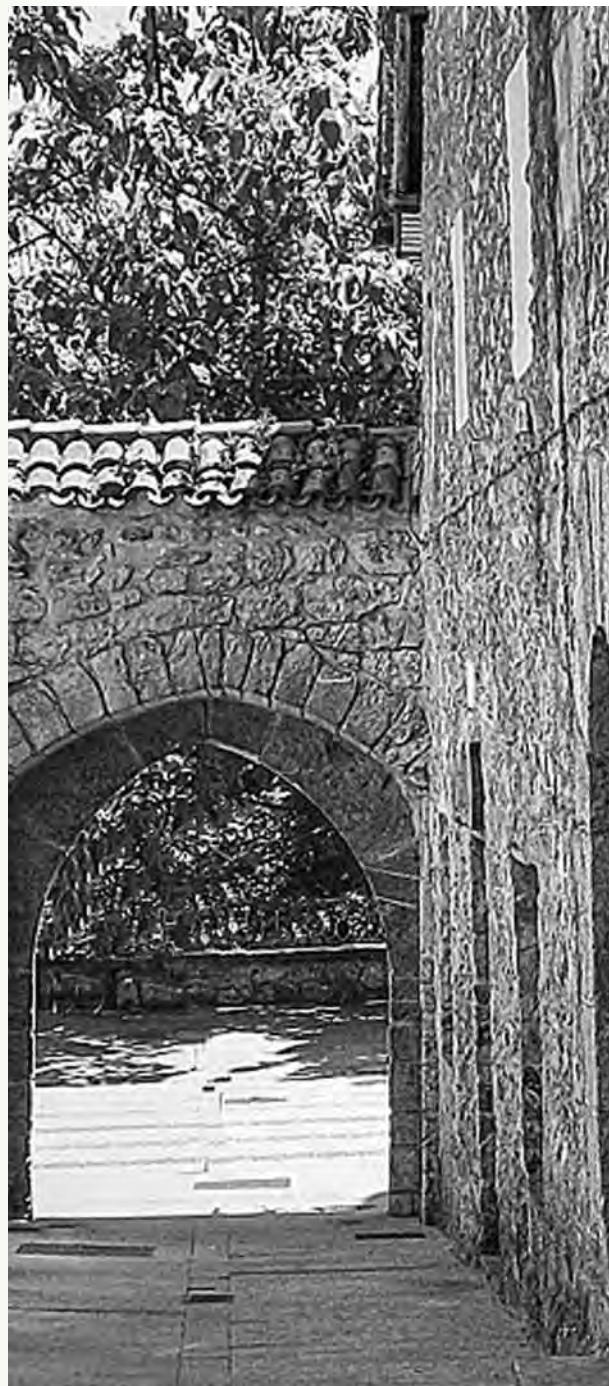
Felipe Sagarna Zapa kalean portaleetako bat (ateetako bat) kontserbatzen da.