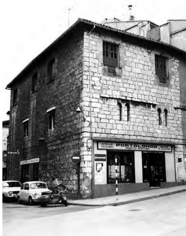
Jentilen dorrea edo Portalondo etxea, gotor-etxe bat Hernaniko herri-gune historikoan.

Babes edo harresi hauek testigantza-izaera edo izaera sinbolikoa izango dute gehienbat, eraso baten aurrean ez baitziren oso eraginkorrak: 1332an, 1512an eta beste urte batzuetan setiatu, arpilatu eta erre zutenean agerian jarriko den bezala.