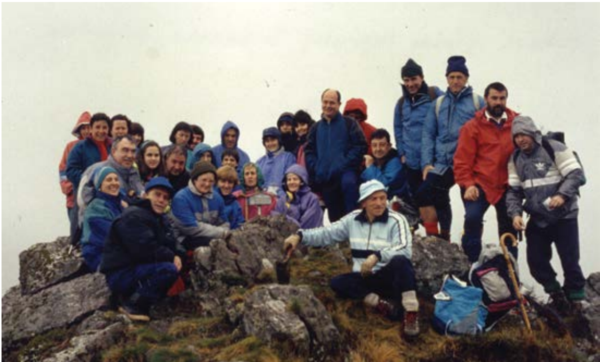
1993-04-18. Zaburuko buzoi konpondu ostean, berriro jarri zen eguna.

90.eko hamarkadan, buzoi oso hondatua zegoen, eta konpontzeko behera jaitsi genuen buzoi. Konpondu ostean, jarri zuen koadrilarekin hitz egin, eta denok elkarrekin joan ginen berriro jartzera. Egun berezia izan zen, alde batetik, egun bera errespetatu zelako, 1993ko apirilaren 18an jarri baitzen berriro. Bestetik, 1954an jarri zuten asko ere bertan izan zirelako. Baina, hori gutxi ez, hauen seme-alabak, suhiak etab. ere joan ziren egun hartan. Jartzeko prozesua, egun berezi bihurtuz.