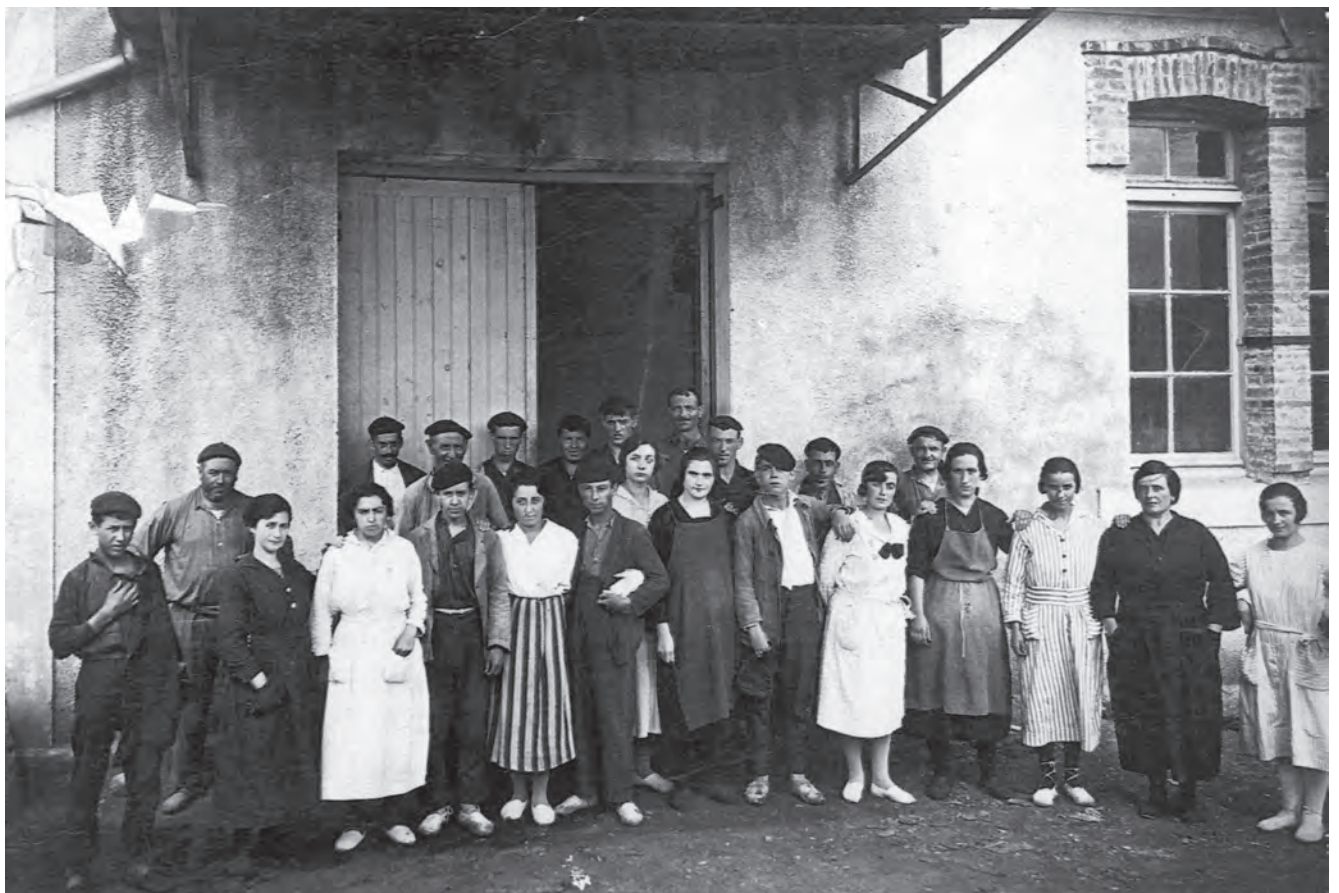
1940ko hamaikadan emakume asko lanean zituzten papegintzan.