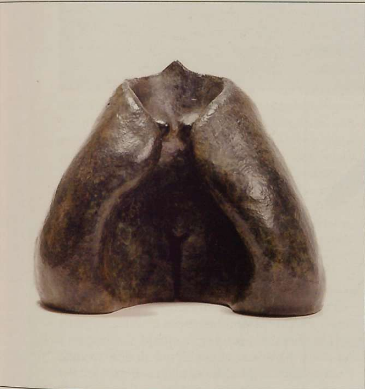
Emakumea II • (brontzea, 17x17x14).