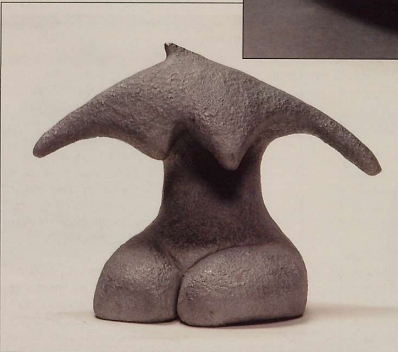
Emakumea III • (aluminioa, 22x26x14).