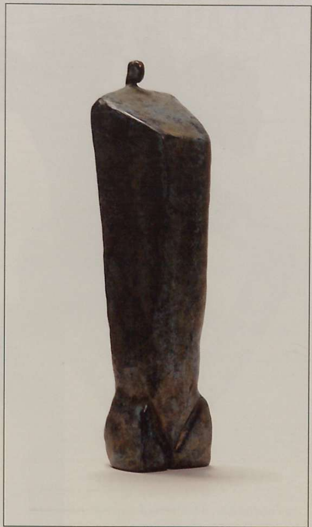
Gizona I • (brontzea, 23x5x5).