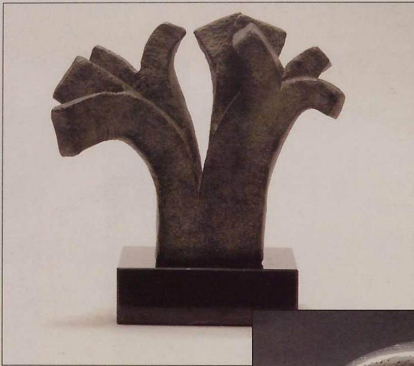
Zuhaitza • (brontzea, 20x20x10).