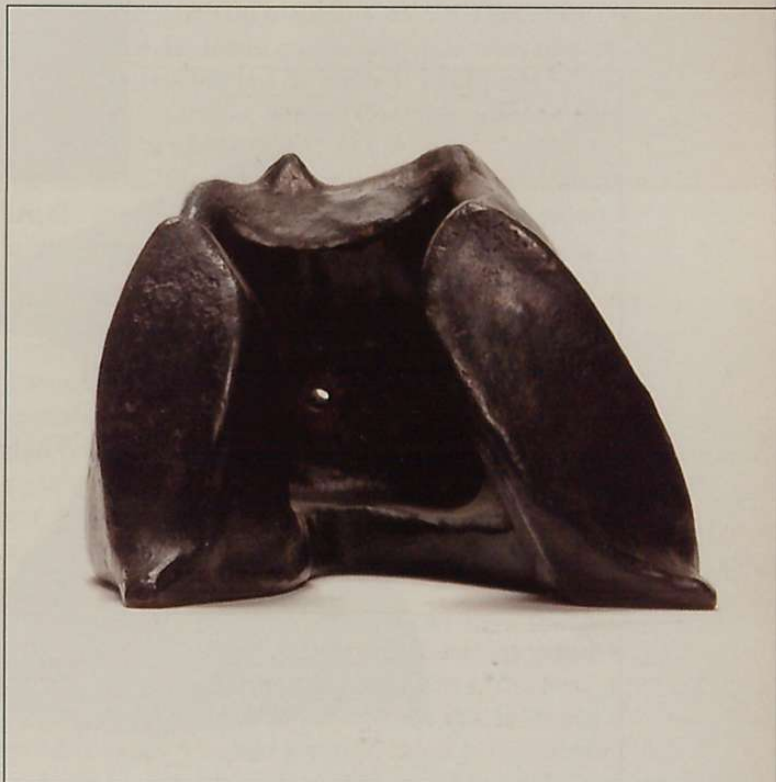
Gizona II • (brontzea, 14x18x16).