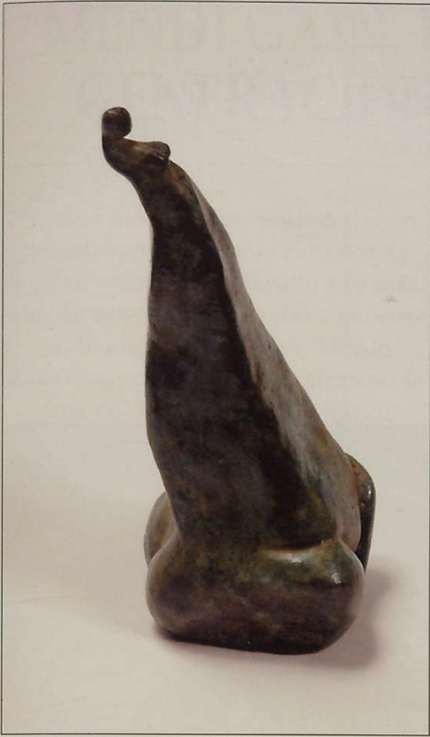
Emakumea I • (brontzea, 17x17x14).