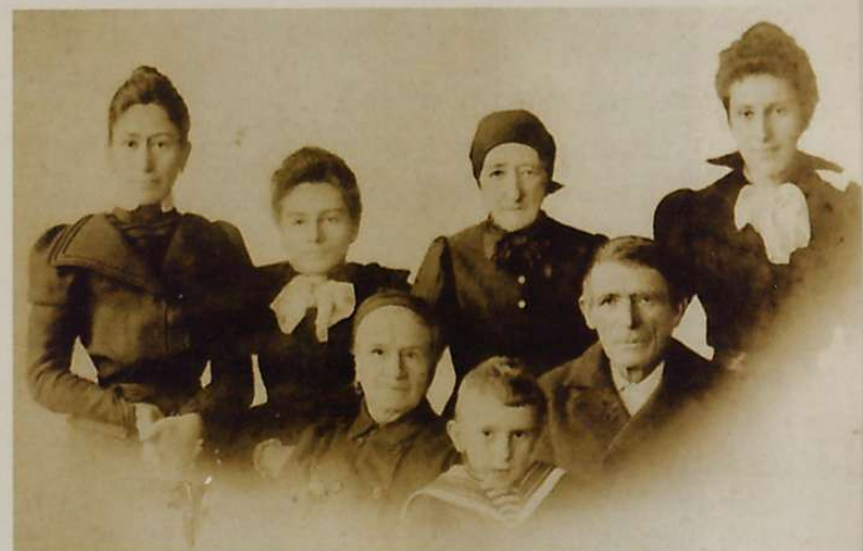
Izagirre-Zubillaga sendia. 1898

izan behatzean lehen zitzada eskolan hartua zutela; han ikasi baitzuten titarea erabiltzen, trapu bat behatz artean ibiltzen, hariak atera