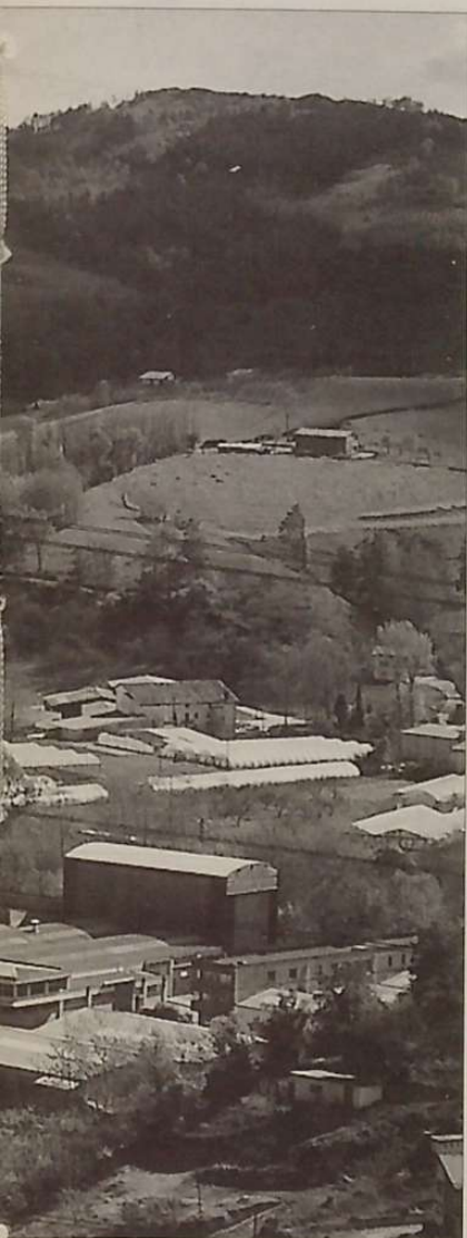
Polígono Industrial de Eciago.