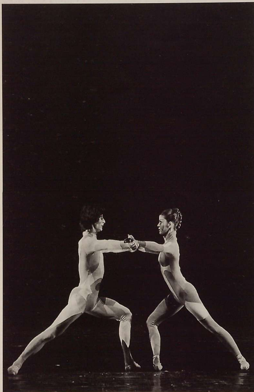
Ballet Théâtre Français de Nancy. 1979 - 1981.

Un compañero de Anexa me dijo: tú tienes que bailar en Wallonie, ¿por qué no hablas con ellos y solicitas audición? Me presenté e hice la audición; el resultado fue muy grato: les gusté y me invitaron a ir con ellos. Fue una decisión arriesgada, ya que en Bélgica no había nada seguro, y aquí dejaba unos padres no muy convencidos y un trabajo fijo. Allí volví a hacer otra audición y entré en la Compañía de Wallonie donde estuve dos años.