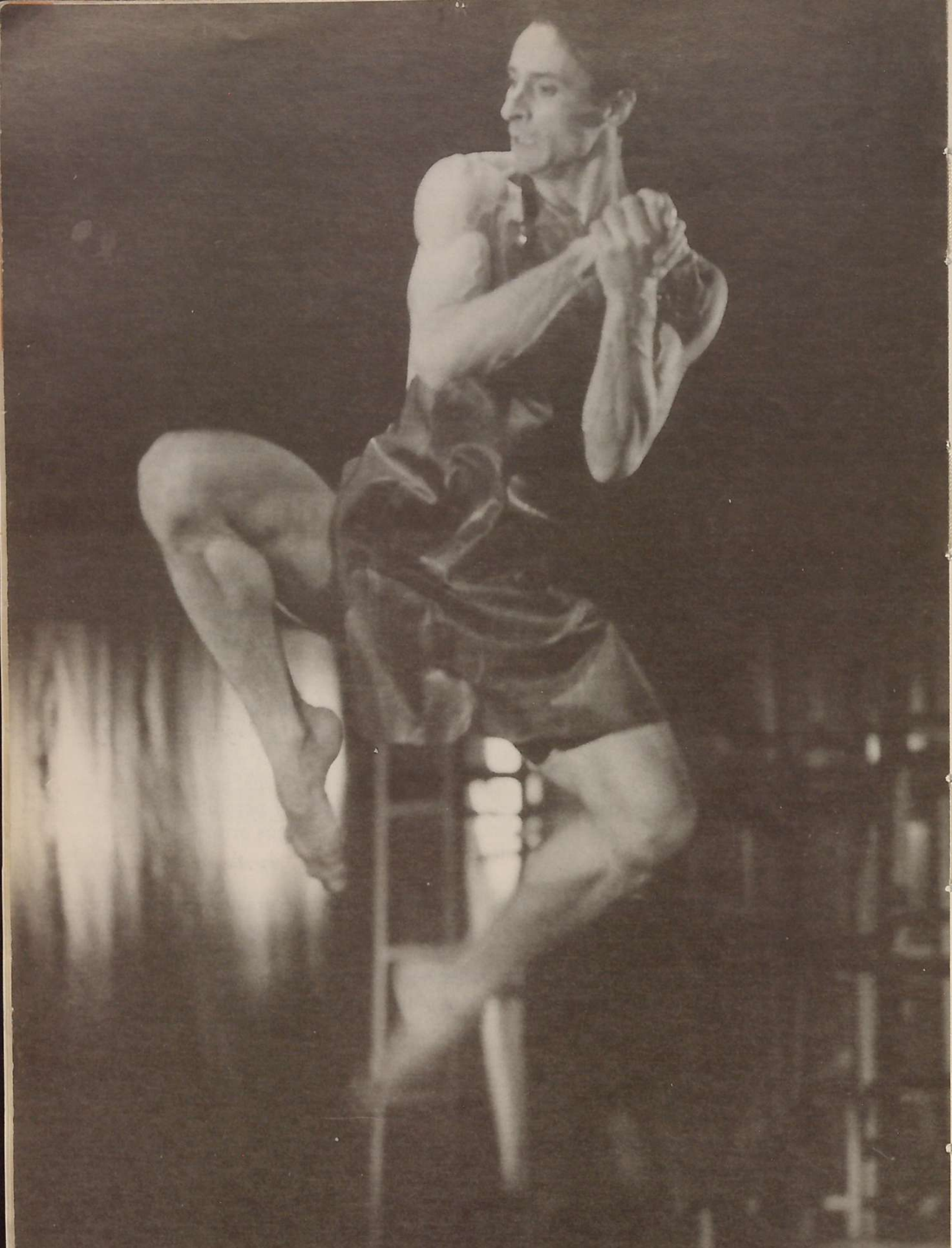
Tanztheatre Wuppertal de Pina Bausch. 1987 - 1993.