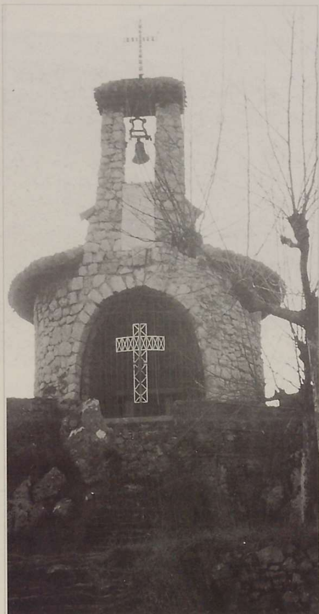
Reconstrucción de la Ermita de Santa Bárbara.

nidad, tras lo cual, los beneficios obtenidos se repartían entre los vecinos y moradores derecho-habientes o se destinaba parte de los mismos a atender las necesidades de la villa (pagos atrasados a los asalariados de la villa, construcción o reconstrucción de edificios, etc.).