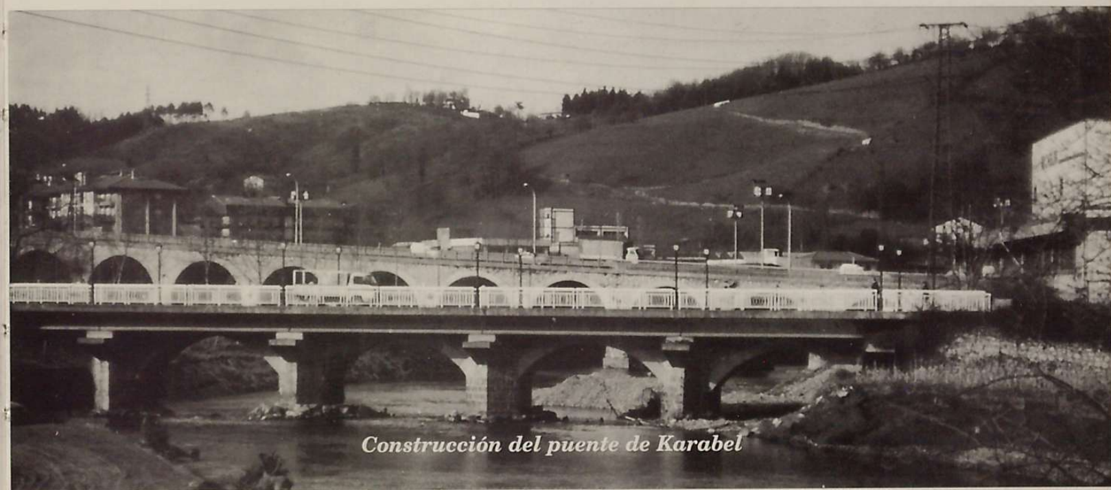
Construcción del puente de Karabel

Por otra parte, sin olvidar las concesiones que eso sí, de forma ocasional y circunstancialmente, se otorgaban a vecinos y moradores para que explotaran agrícola-mente determinadas porciones de los referidos montes por medio de la puesta en rozadura de las mismas, o los permisos de pasturización que se otorgaban a propietarios de ganado, afirmamos que el aprovechamiento y uso fundamental a que se destinaban los Montes Francos del Valle de la Urumea era