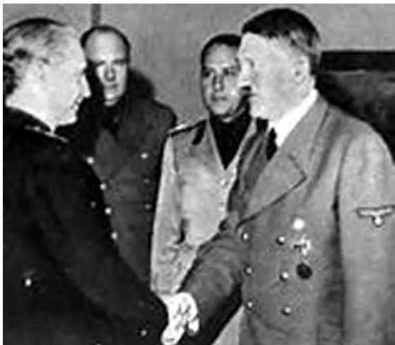
Ramon Serrano Suñer Hitlerrekin bilduta, Berlinen.

aurrean, Frantzia finkatutako euskaldunak eta espainiar errepublika aldekoak Frantziako armadan sartzeko agindua eman zuten. Euskaldun gehienak Langile Atzerritarren Konpainietan eman zuten izena eta Maginot lerroa gotortzen aritu ziren, Alemania eta Frantzia arteko mugan eraikitako defentsarako azpiegitura sare erraldoia, alegia. 1940ko maiatzean Wehrmacht alemaniarrek erasoaldi azkarra hasi eta aste gutxiren buruan Herbehereak, Belgika,