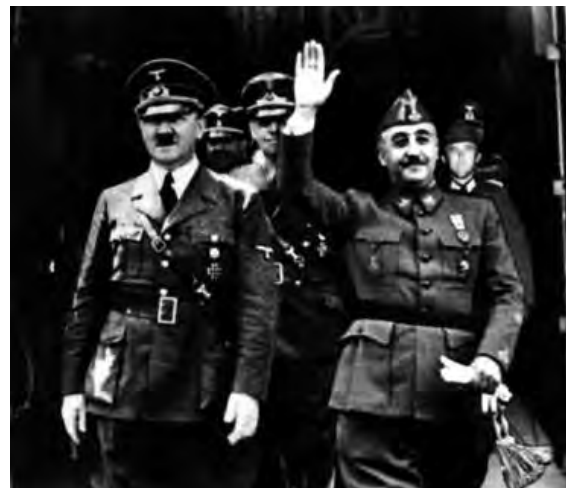
Franco eta Hitler Hendaiaiko tren geltokian bilduta.

Franco eta Hitlerrek ideia ugari zituzten komunean, faxismoa izanik haien gobernuen oinarria: izaera totalitario eta nazionalista duen doktrina, hau da, buruzagi bakarraren baitan datzan gobernuak, indarraren erabileraren bidez ezarria.