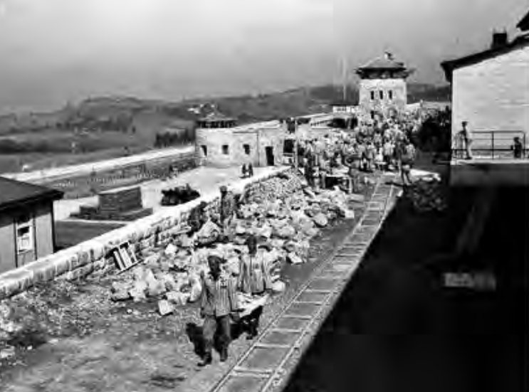
Mauthauseneko kontzentrazio esparrua.