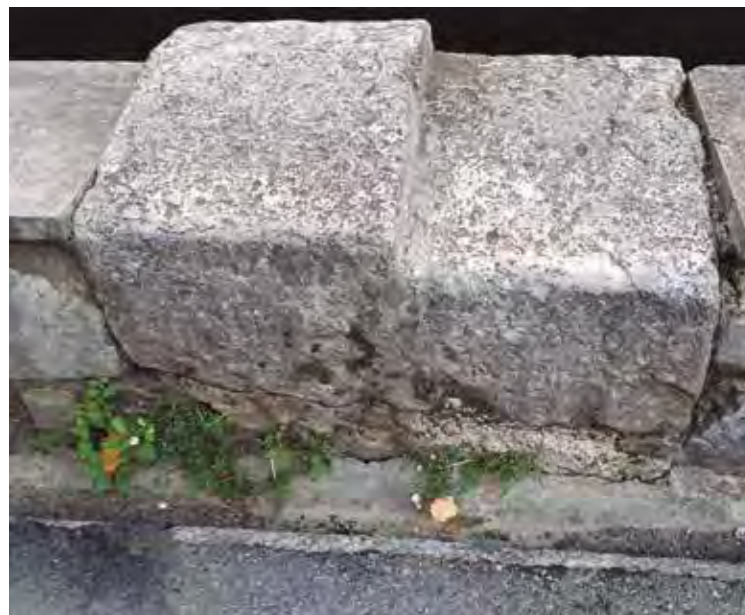
1720an erabilitako botarria oraindik Tilosetan dago, Izpizua kalearen aldeko pretilean.