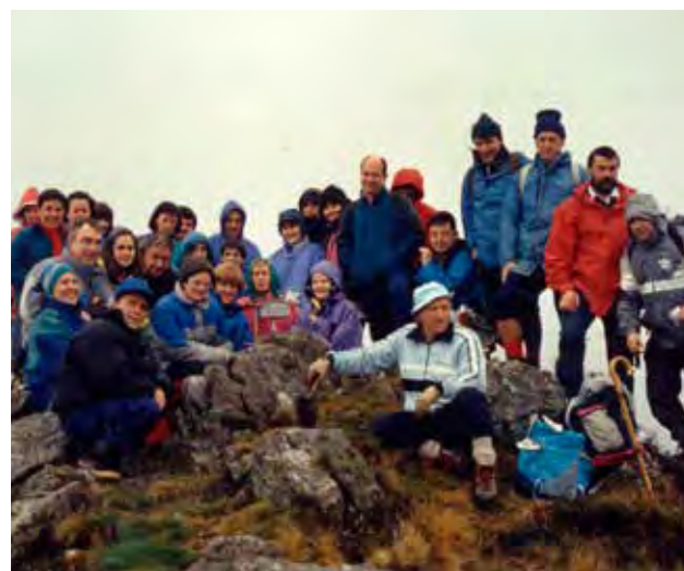
1993-04-18. Zaburuko buzoia konpondu ostean, berriro jarri zen eguna.

Baina, hori gutxi ez, eta hauen seme-alabak, suhiak etab. ere joan ziren egun hartan. Jartzeko prozesua, egun berezi bihurtuz.