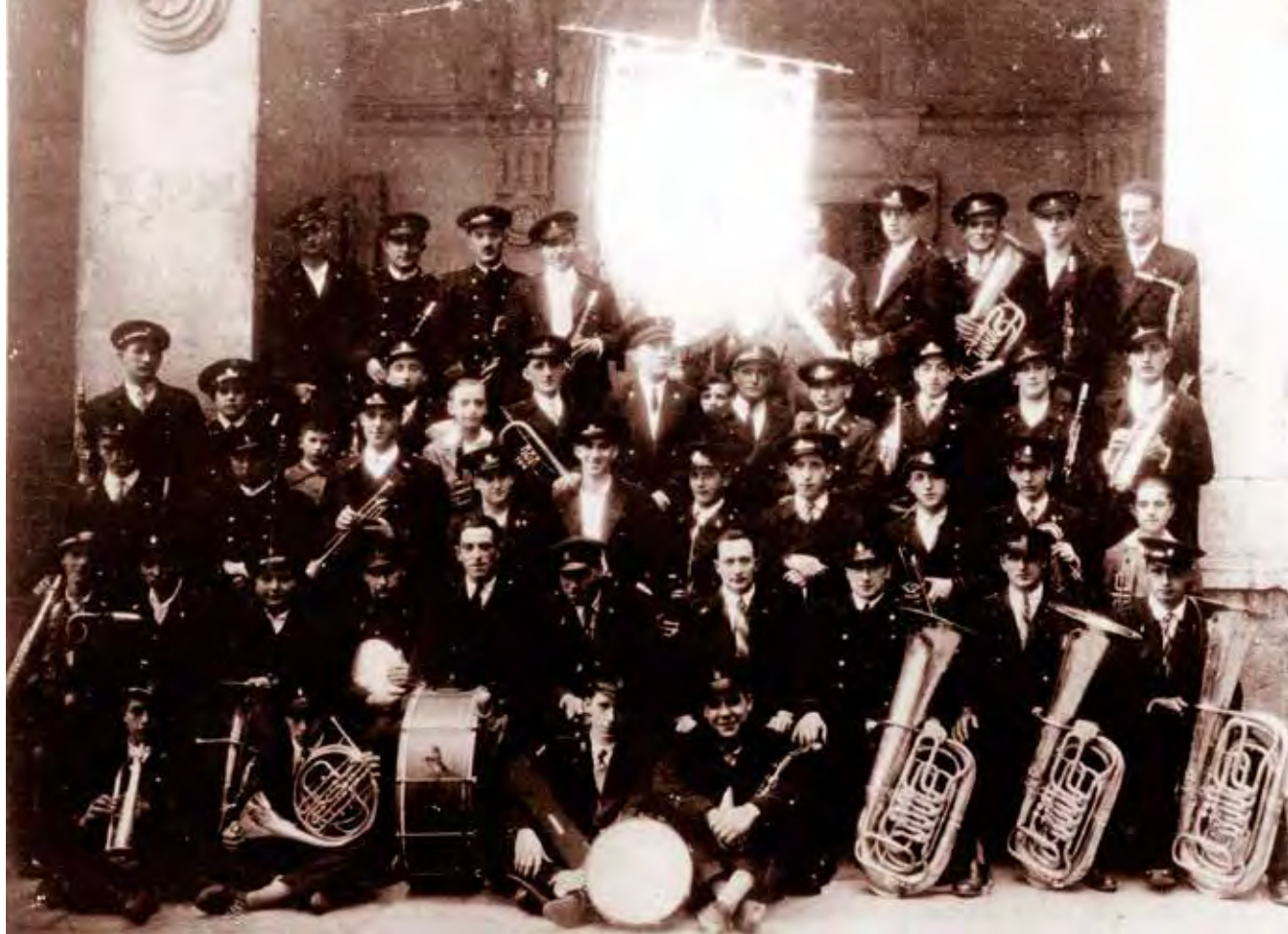
Musika Banda, 1933. urteko San Joan egunean udaletxeko arkupetan.