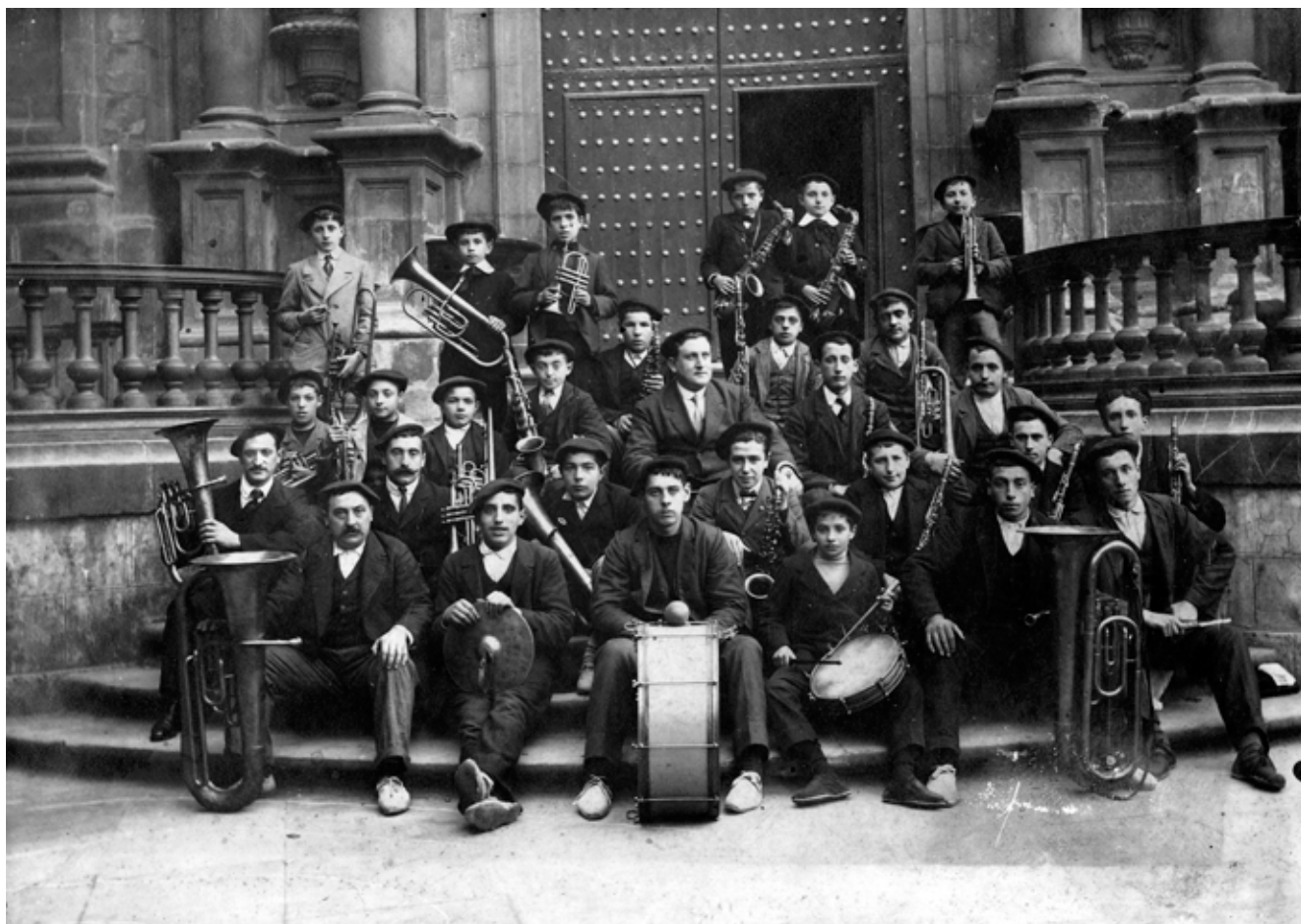
Hernaniko Musika Banda 1910eko hamarkadan.

1899: Bandak araudi berria publikatzen du. 1877koa eta 1895ekoaren ondoren, hirugarren araudia izango da honakoa. Moldiztegi batean inprimatua, zuzendariari botere ugari emango dio.