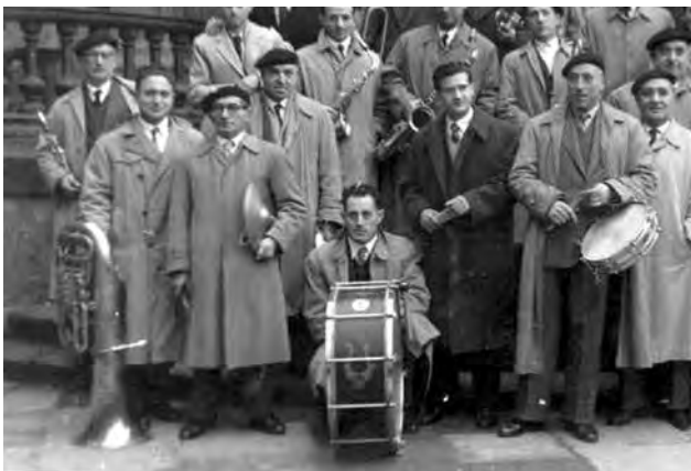
Banda Urumea parroikiko eskaileratan (1953-06-28).