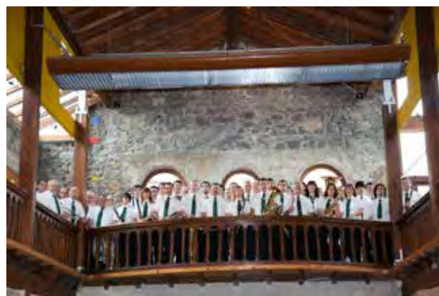
Hernaniko Musika Bandako musikariak Milagrosan (2011).

2011: 150. urteurreneko ospakizunak. Bandak uniforme, logo eta himno berriak sortzen ditu eta makina bat ekitaldi egingo ditu herriko beste taldeekin elkarlanean. Mende eta erdia gogoratzeko liburua kaleratuko dute.