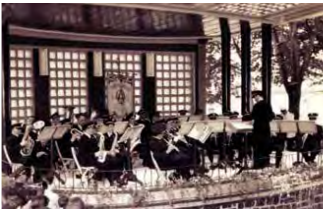
1957ko ekainaren 24an, San Joan egunean, Musika Bandak kontzertua eskaini zuen Tilosetako pasealekuko musika kiosko berrian.

1961: Sorguiñeta obra estreinatuko da San Joan bezperan Hernaniko plazan. Hernaniko Schola Cantorum-ek eta herriko zuzendari eta musikariek parte hartuko dute, Donostiako kontserbatorioko orkestra sinfonikoak eta Olaeta baletak lagunduta. Ikuskizunak sona handia hartuko du Euskal Herrian eta Euskal Herritik kanpo.