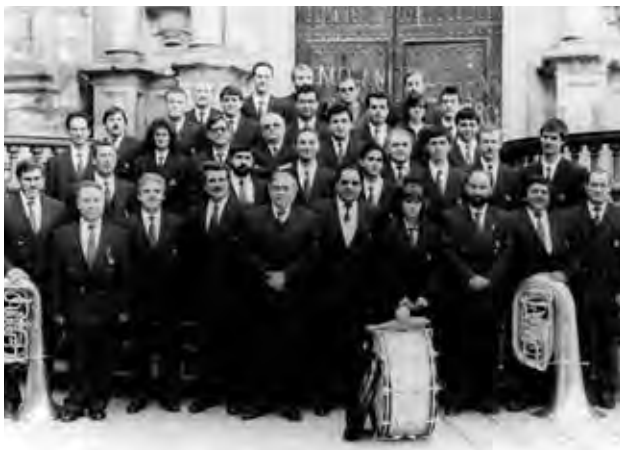
Hernaniko Musika Banda, 1991.

1992: Hernaniko banda Gipuzkoako banden federazioan sartzen da.