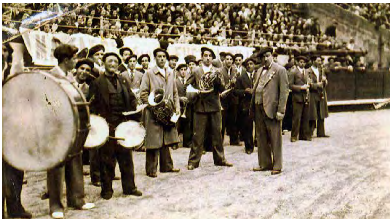
Musika Banda, 1935.eko maiatzaren 5ean, Donostiako Chofre zezen plazan.