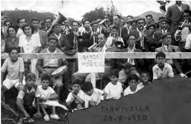
1950: Txantxilla futbol zelaia inaugurazioan, 1950.