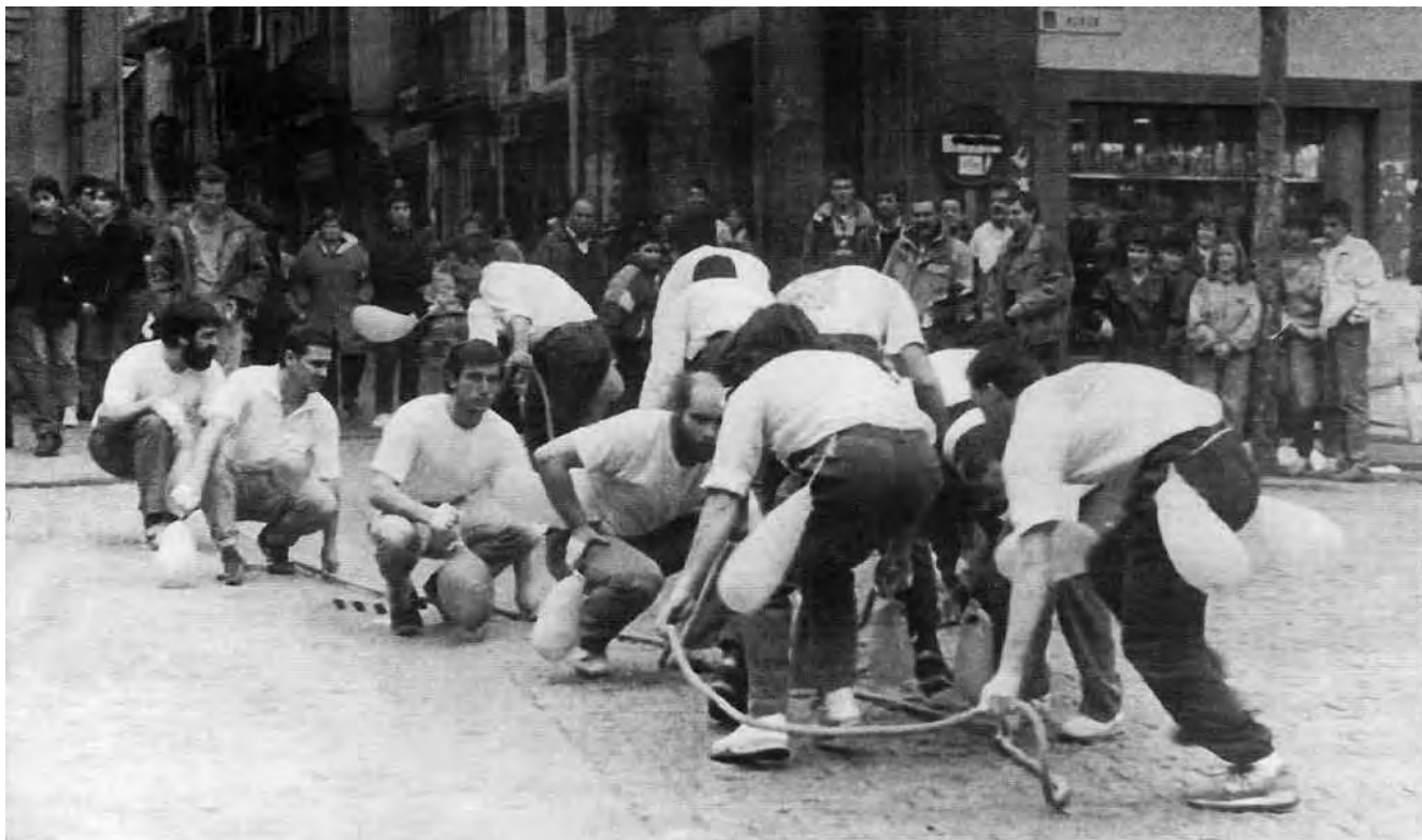
Azeri dantza Hernaniko Ihauterietan. Soka gaineko dantza.

Aipatutako ibilera galdu bazen ere, azkeneko urteetan ihauterietan berreskuratu izan da, dena den, aspalditik Azeri dantzan bai hasieran eta bukaeran sokaren atzeko bi muturrak lurrean utzirik lagun guztiak gainetik pasatzen dira. Zati honi, Ansore-