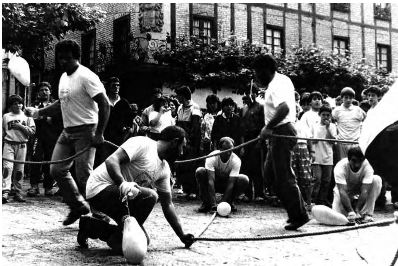
Azeri dantza, Hernaniko San Joanetan. Bukaerako dantza.

Garai batean umeez honako kanta abesten zuten dantzaren melodia berdinarekin: