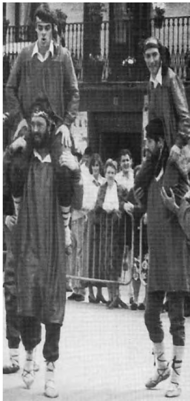
Azeri dantza Andoainen. “Dorre Borrokak”.

Hernanin, XVIII, mendean zehar Azeri dantzaren presentziaren lekukotasunak artxiboko zenbait aipamlenetan ere aurki daitezke. Hauen arabera, herriko zein inguruko jendeek parte hartzen zuten eta horren truke gosaria pagatzen zitzairen.