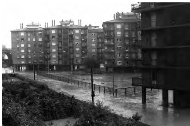
1983ko abuztuaren izandako uholdeak Karabel auzoan.

1981eko urtarrilaren 16an. Euriaren eta mendi-ton-torretako elurra urtzearen ondorioz, Gipuzkoako hainbat herritan izan ziren uholdeak. ABC egunkariaren arabera, Urumea, Oria eta Deba ibaiek egin zuten gainezka, besteak beste. Hernanin bertan hainbat zelai geratu ziren urpean, eta Urumeako urek Martutenen, Astigarragan eta Ergobin ere egin zuten gainezka.