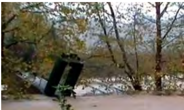
Errugbi taldeko jokalariek grabatu zuten bideoa: "Elorrabiko zubia".

Osiñagan uholdeek izan zuten eragina ere ez da erraz ahazteko modukoa. Altzueta, Iparragirre eta Elorrabi sagardotegietan sartu zen ura, eta Elorrabiko zubia urak eramane zuen. Hernanitik kanpo ere ezaguna egin zen errugbi taldeko jokalariek grabatu zuten bideoa. Telebista kate batean baino gehiagotan erakutsi zuten Urumearen indarrak zubia nola puskatu eta eramaten zuten.