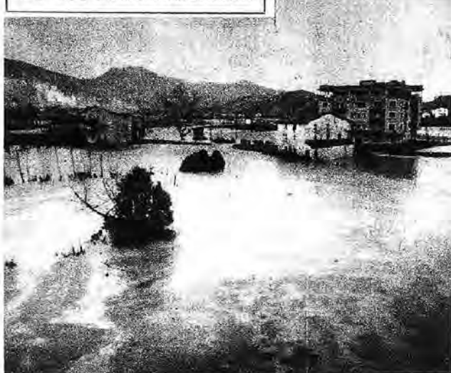
Ha aquí un aspecto del valle de Hernani completamente inundado por las aguas.

La ciudad de Pamplona es la vida asistida por un vistoso temblor de agua y nieve. La capital navarra sufrió la inundación de algunos de los grandes ríos, como consecuencia del agua que trae en las riadas procedentes del monte San Cristóbal y por el desbordamiento del Arga. Las dos fotos de arriba, derecha, muestran al barrio de la Rochapea anegado por completo.