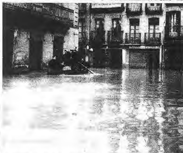
Note gráfica de una calle de la ciudad de Estella cubierta por las aguas. En esta ciudad fue necesario el uso de bates para socorrer al vecindario, que se vio bloqueado por la inundación.

"He aquí un aspecto del valle de Hernani completamente inundado por las aguas".