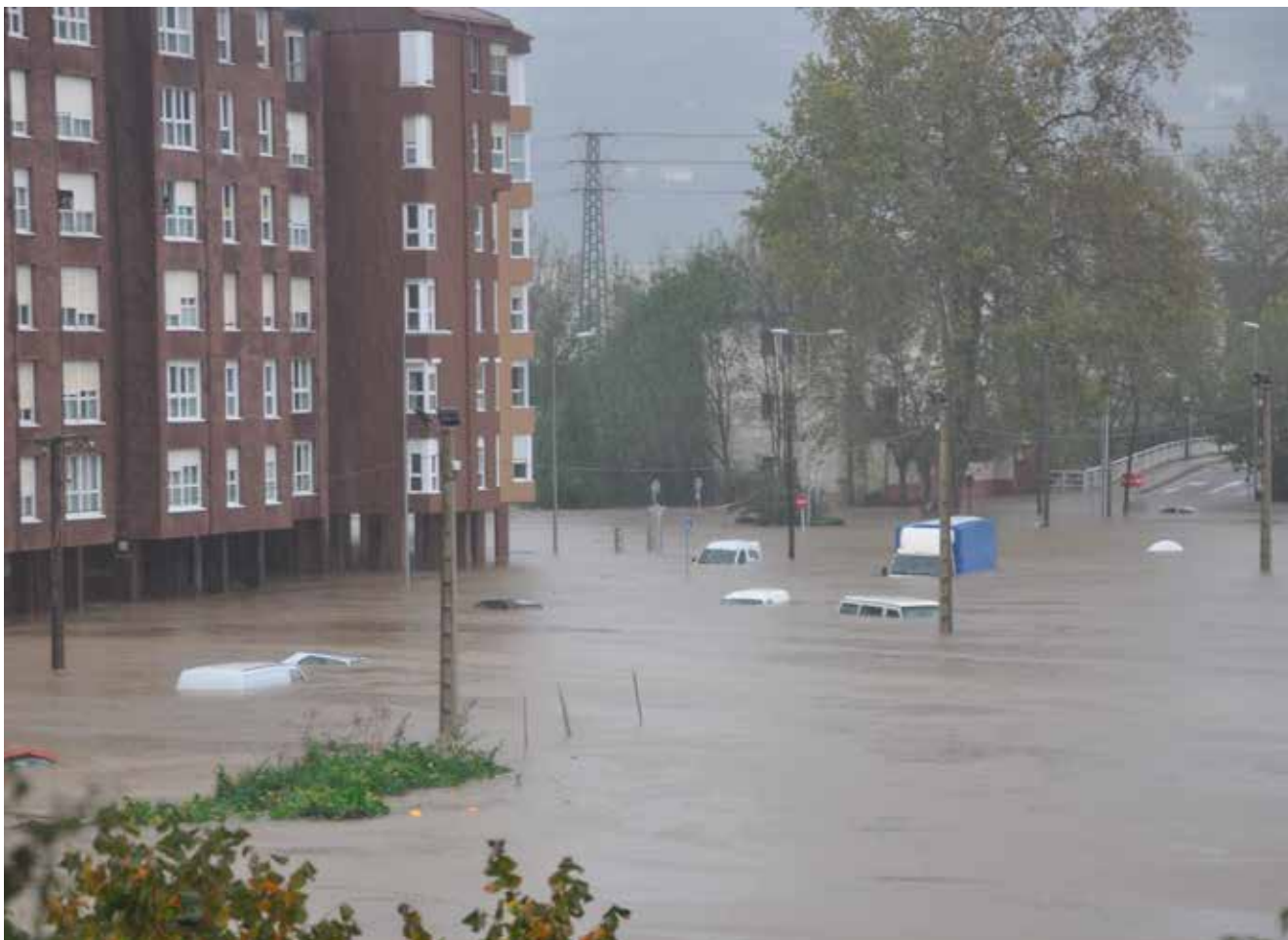
Karabel auzoa, 2011ko azaroaren 6an. Arg.: Hernaniko KRONIKA.biko zubia".

Uholdeak pasa, Añarbek txosten bat argitaratu zuen argitzeko nola jokatu zuten. Bertan, uholdeak zergatik gertatu ziren ere argitu zuen. Informen honen