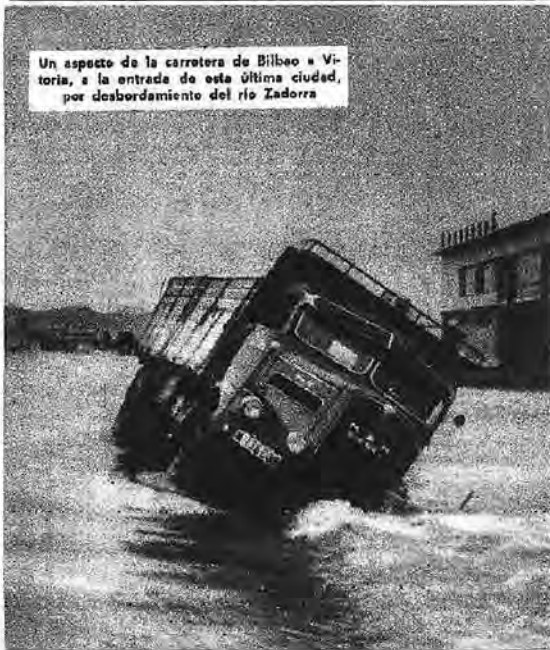
Un aspecto de la carretera de Bilbao a Vitoria, a la entrada de esta última ciudad, por desbordamiento del río Zadorra