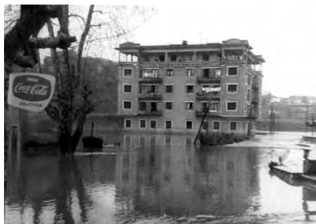
Karabelgo irudiak, 1960ko abenduaren 30ean.

1960ko abenduaren 29 eta 30ean. Garai hartako La Vanguardia Española egunkarian jasotakoak dio, 24 orduetan etengabe egin zuela euria, eta goizeko 07:00etatik eguerdira bitartean 40 litro jaso zirela metro karratuko. Hernaniko Udal Artxiboan dagoen argazkiak erakusten du Karabel auzoa urak hartu zuela Hernanin. La Vanguardiako artikuluan aipatzen da baita ere, Donostiatik Hernanirako autobus zerbitzuak ibilbidea aldatu behar izan zuela, Loiola eta Martutene zeharkatu ezin zirelako. Itsasgora izan zen euri gehien egin zuen momentuan, eta Urumeako urek izugarri egin zuten gora. Hortik egun batzuetara, aipatutako egunkariak uholdeek eragindako hainbat herritako argazkiak argitaratu zituen.