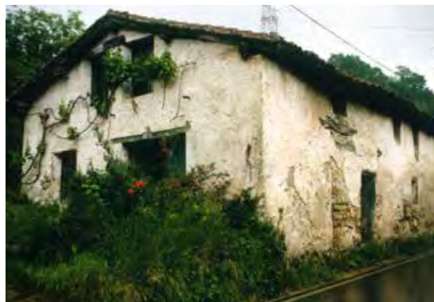
Oficinas de labrar anclas en el caserío Oyanederrenea, en Osiñaga bailara.

A primeros de agosto de 1751 se incorporaron a la producción las cuatro restantes y a partir de entonces el Asiento trabajó con la infraestructura calculada. Previamente a la anunciada devolución de las oficinas de Oyaneder a su propietario el 27 de noviembre de 1752, se levantaron en Fagollaga dos talleres más, con lo que los seis centros de producción proyectados al comienzo del Asiento quedaron reunidos en un mismo lugar.