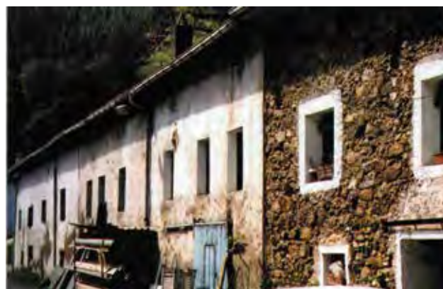
Fig. 3. Vistas de las viviendas desde el lado este.