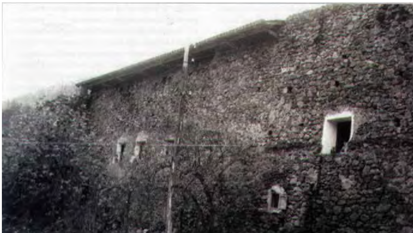
Fig. 4. Lado oriental de las "casas de habitación" de Fagollaga.