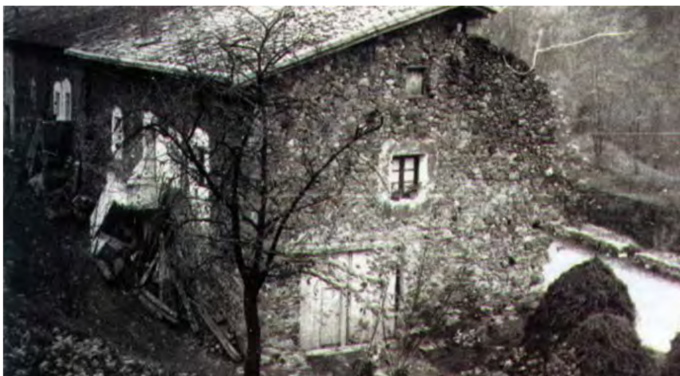
Fig. 5. Vista del otro extremo de la fila de viviendas.

Si se mira hacia el restaurante desde el primitivo camino que viene de Hernani y corre frente a él por el otro lado del río, se pueden observar a su lado, a escasos metros, seis viviendas de altura uniforme adosadas unas a otras. Los edificios, contemplados desde su lado oeste, presentan un cuidado aspecto que, en principio, hace difícil admitir que aquellas viviendas pudieran haber sido hace doscientos cin-