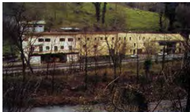
Fig. 2. Vistas de las viviendas de los maestros ancoreros desde el lado oeste.

En el año 1986, en la escritura de compra-venta de una sociedad anónima localizada en la zona, se otor-