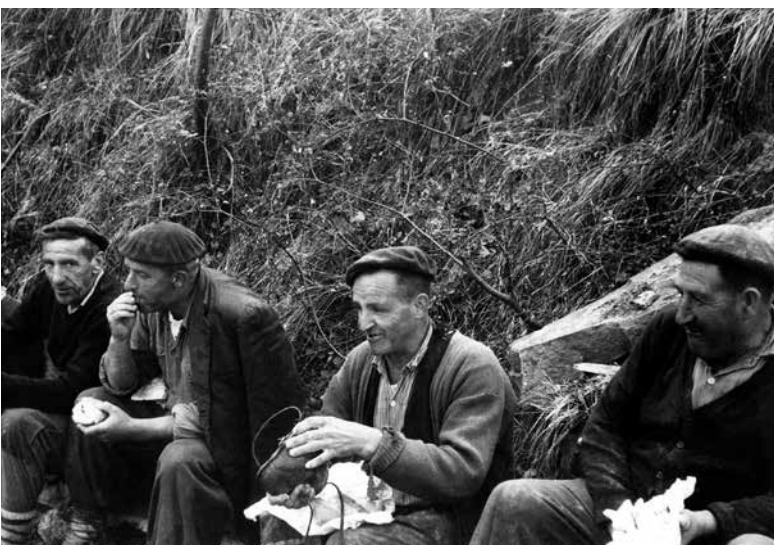
Araldia (aaldiya) Urnietan.