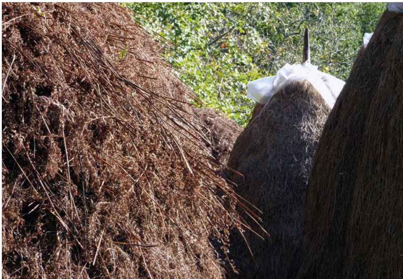
Iñistor-meta ezkerrean, eta belar-metak atzean Alkatxurain baserrian (2015).

Hau dela eta, azken hamarkadetako Hernani urbanoan, iñistor-metak, bizitzeko modu baten azken arrastoak bihurtu dira.