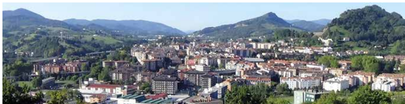
Hernani hoy, desde la zona de Montebideo (fotografía: Iñaki García de Vicuña).

Según nuestra manera de ver el proceso, esta amenaza al tráfico por el Urumea, ocasionó la proyección del puerto de Hernani hacia el litoral, originando así la población de San Sebastián.”