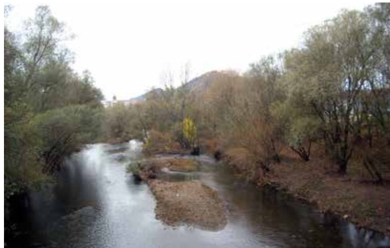
En el centro de la imagen, el área donde se hallaría, aproximadamente, el puerto de Karapote.

Estos nuevos datos son escasos en cantidad pero importantes por la información inesperada. Además,