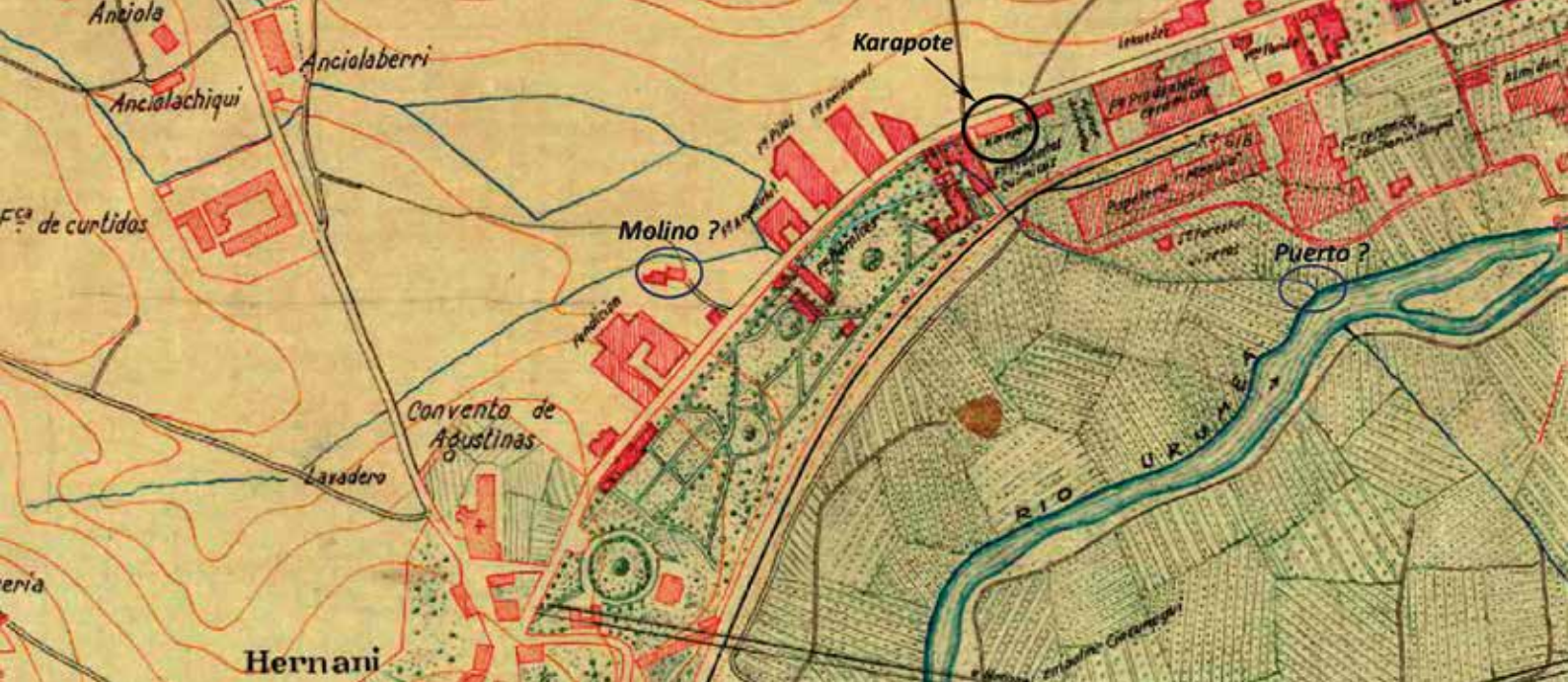
Hipótesis de la localización del puerto de Carapote (sobre un plano del año 1900).

y transportes que tienen dichos puertos desde el de Osinaga asta el de Carapote se le hiciere novedad, le defenderá la villa a su cuenta y costa al rematante.” Hay más ejemplos como estos, pero con estas menciones tenemos suficiente para poder confirmar la existencia de un puerto en el Urumea llamado Carapote.