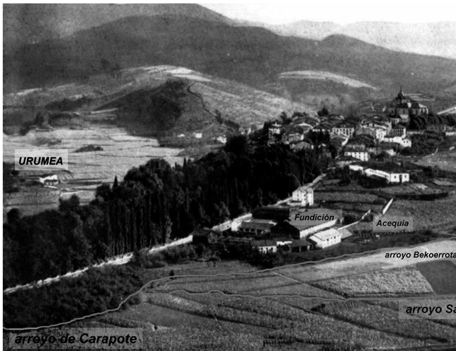
Hernani hacia 1905 - 1910, fotografía tomada desde la zona de Montebideo. En primer término se distingue el trazado del tranvía San Sebastián - Hernani, inaugurado el 2 de agosto de 1903.