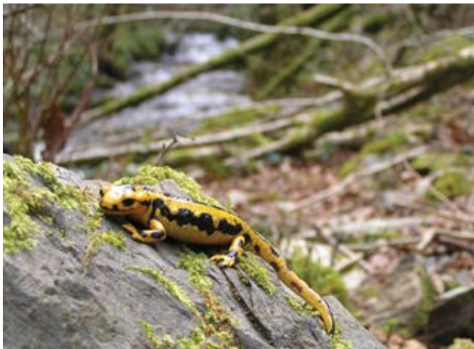
Arrobiyua Etxolaberri baserriaren azpialdeko errekan.

"Burbunak eta etsayak" proiektua aurrera eramane dugunok segituan sumatu genuen hori. Arrobiyua animalia berezia da. Baserriz baseri ibili gara Hernanin, naturari loturiko hitzak, esamoldeak, ipuinak, mitoak eta kondairak biltzen. Eta bertan jaso ditugu naturari lotuta bizi izan diren, eta bizi diren, pertsonen kontakizunak eta jakituria.