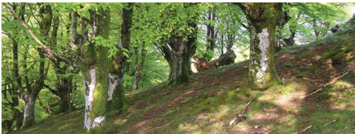
Ezteizar: Etxolaberri alboko pagadi-hariztia. Basomutilek urtetan lan egindako basoa.

Ereñotzu inguruko baserrietan ahoz aho igaro da, belaunaldiz belaunaldi, arrobiyua janda hil ziren basomutilen istorioa. Eta hortik denek atera dute ondorio garbi bat: "Arrobiyuak benenua dik!".