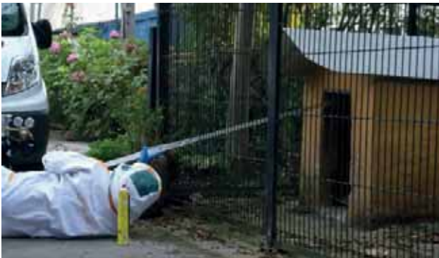
Aterpe baserriko txakurren etxolan.

Azpiko argazkietan ikusi dezakegu gure boluntarioen taldekide batzuk kabi desberdinak pozoitzen: