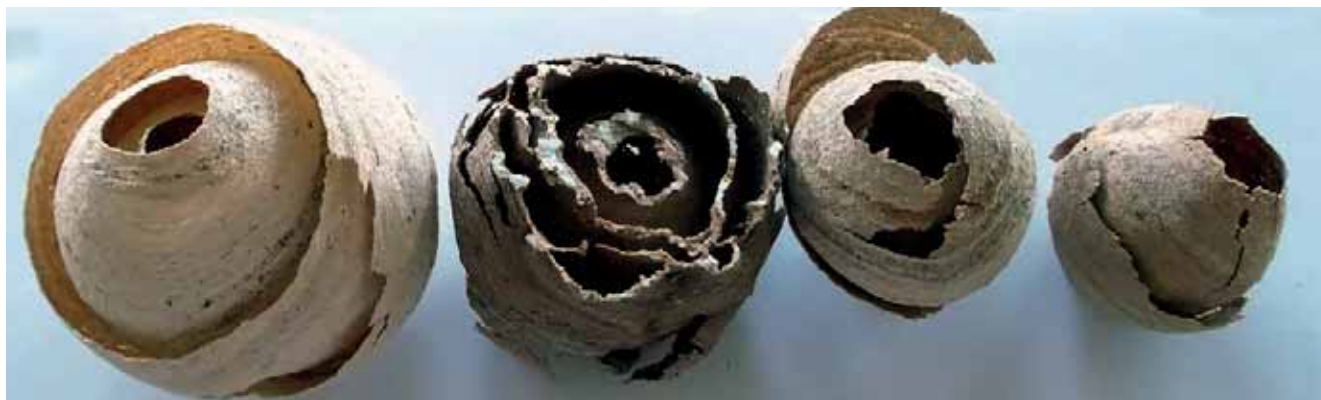
Hernanin kendutako habi primario batzuk.

Garbi ikusten genuen herritarren parte-hartzea funtsezkoa zela, eta horrela izan zen. Informazioa ematen hasi bezain pronto hasi ginen deiak jasotzen. Apirilaren erdialdetik iraila arte 33 habi primario suntsitu ziren; horietako 8, herritarrak kenduta izan dira, eta gainontzekoak, udaltzainek.