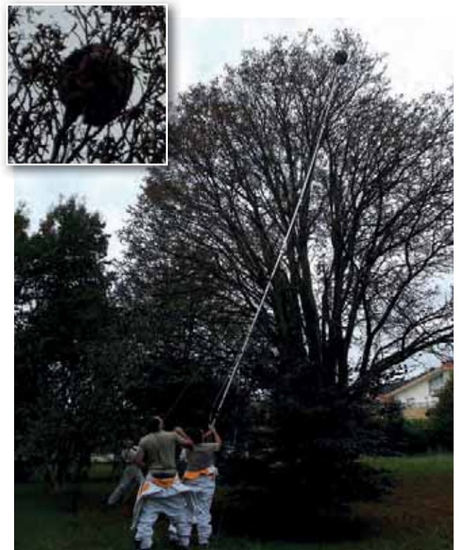
Santa Barbara auzoan.

Artikulu hau bukatzeko, nahiz eta lehen esan, azpimarratu nahi dut herritarren aldetik jaso dugun erantzuna benetan zoriontzekoa izan dela, oso herri bizia dugula adierazten du horrek: