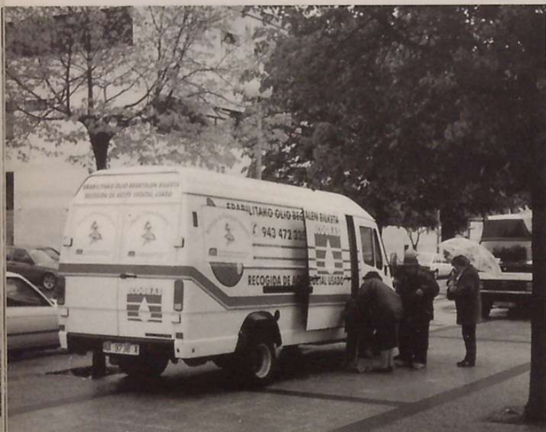
Herritarron kolaborazioa: olio erabilia ECOGRAS-ekoei ematen. Bildutako olioarekin, besteak beste, autobusek erabiltzen duten biodiesela egiten da.

ekerraraztea ez dago hain eskuera, eta bistan dago oso garrantzizkoak direla helburutzat dugun garapen jasangarrirako. Hernanin kokaturik dauden industria kutsatzaileak