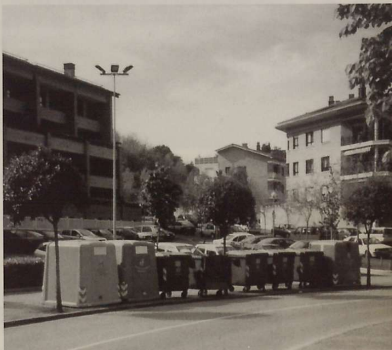
Lehenik: kontsumoa gutxitu; bigarrenik, erabilitakoa berriz erabili; eta azkenik, hondakinak gaika bildu. Horretarako ditugu ontzi aproposak.

berunik gabeko gasolinaren erabilera. Zoritxarrez, asko gelditzen zaigu, oraindik, garraio publikoa benetan indartzeko, eta erabiltzen dugun erregaia gero eta ekologikoagoa izateko. Ez dugu ezer esan bizikletaren erabileraz. Holandara antolatu beharko ditugu txangoak, hango ohitura osasungarria eta naturarekiko errespetuzkoa guztiz kutsa dakigun.