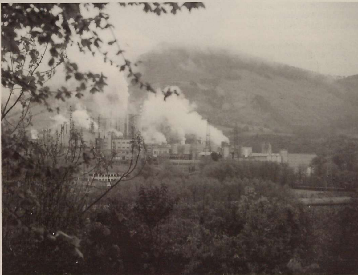
Industriak beharrezkoak ditugu, baina guztion bizi-kalitateari, al bait kalterik gutxien egingo diotenak.

Aurreko guztia egia izanagatik, horrek ez gaitu eraman behar ardura besterena dela pentsatzera, ardura soilik industria multinazional eta agintari boteretsuena dela uste izatera. Dagoeneko hasiak gara hernaniar mordoska bat munduaren zati handi bat bere baitan hartzen duen plan horretan, XXI. menderako den plan horretan, partaide izaten, ekintza xumeak baina aldi berean garrantzizkoak egiten hasiak garenez gero: gutxiago kontsumitzen, hondakin gutxiago sortzen eta hauek birziklatzeko bidea egiten hasiak garenez gero. Orain, hori bai, egindakoa baino askoz gehiago dugu eginkizun, eta badakigu esaera zuhur batek zer dioen, besteri eskatzen hasteko norberak behar duela hasi etsenplu ematen.