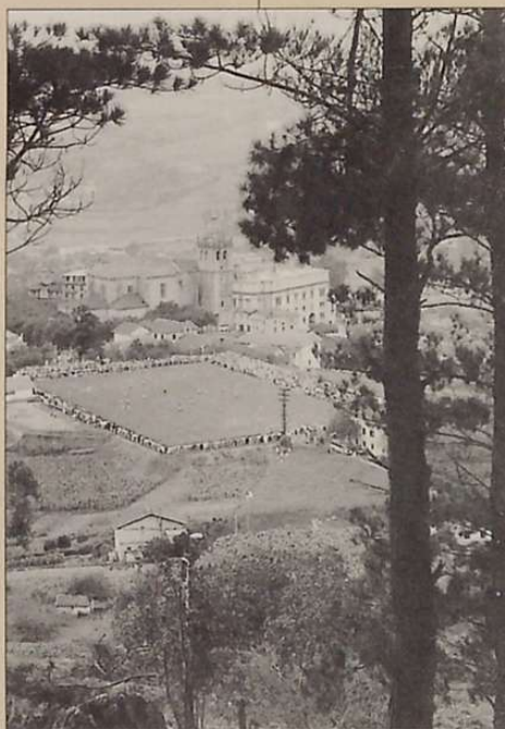
TXANTXILLA FUTBOL ZELAIA (1950/08/27)