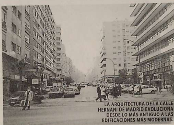
LA ARQUITECTURA DE LA CALLE HERNANI DE MADRID EVOLUCIONA DESDE LO MÁS ANTIGUO A LAS EDIFICACIONES MÁS MODERNAS.

El Alcalde Presidente del Ayuntamiento de la Villa de Hernani no se demoró en dar respuesta a tan grato honor mediante el siguiente oficio 2 :