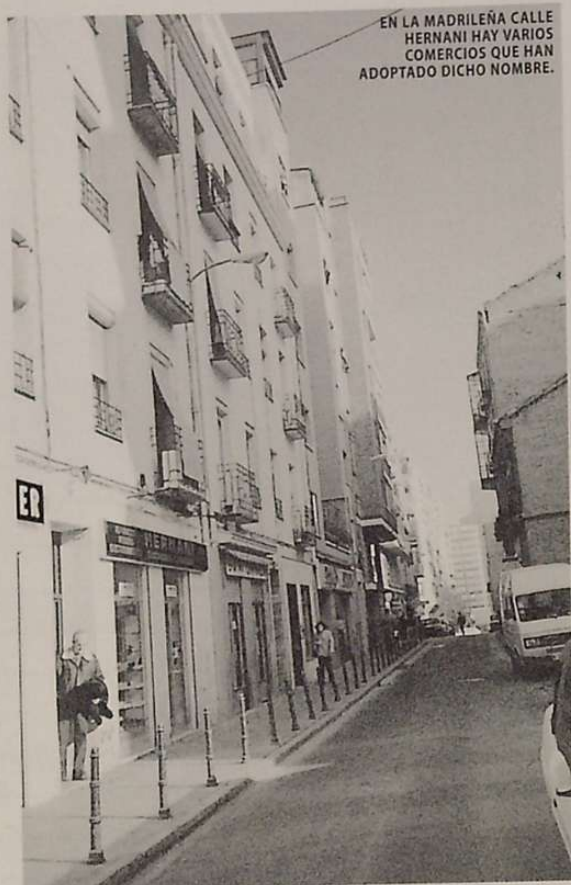
EN LA MADRILEÑA CALLE HERNANI HAY VARIOS COMERCIOS QUE HAN ADOPTADO DICHO NOMBRE.